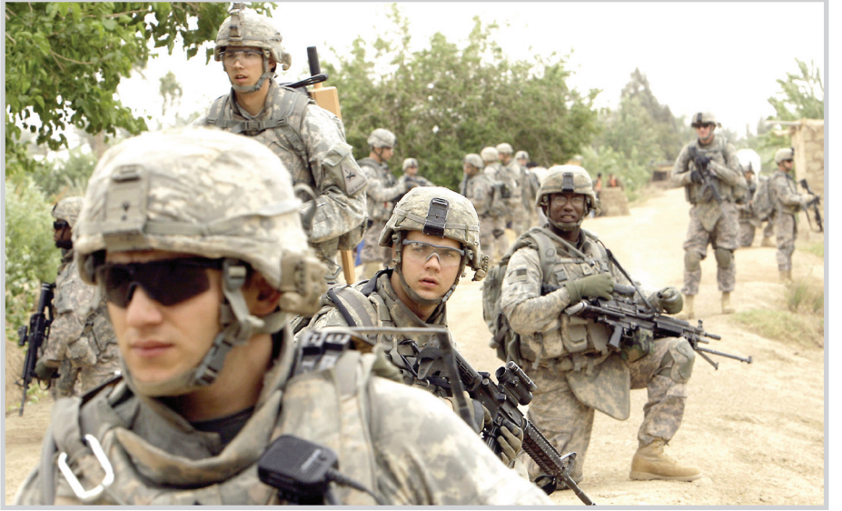
جنود اميركان في مهمة قتالية قبيل الانسحاب الى خارج المدن