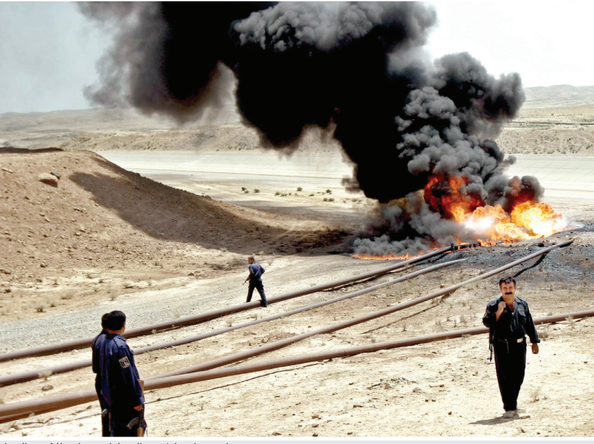
استهداف انايب النفط استنزاف للثروة العراقية