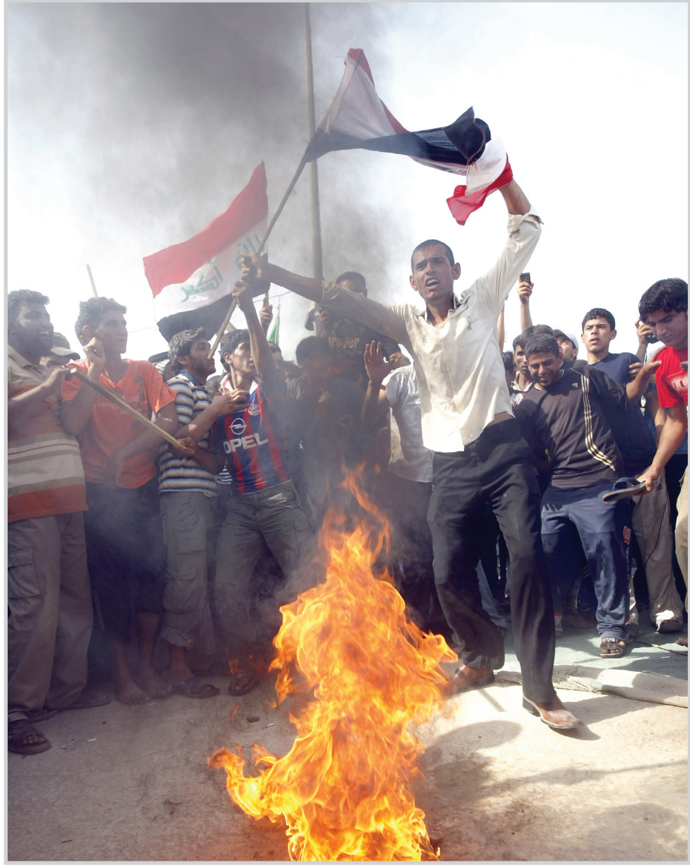
القومية العربية في مفترق طرق

فدتهورت الفكرة القومية، وأخذ نجمها بالأفول، ولم يبق من زعيم على الساحة العربية له هم قومي واضح، غير معمر القذافي الذي تبني فكرة القومية العربية تبنيّاً شاعرياً ورومانسياً، بعيداً جداً عن أرض الحقائق السياسية والتطبيقات الواقعية، والدليل على ذلك، تخلي القذافي عن الدعوة القومية العربية، وتبني الدعوة القومية الإفريقية وتنصيبه ملك ملوك إفريقيا في ٢٠٠٨، وسعيه إلى إقامة الولايات المتحدة الإفريقية UFA على غرار الولايات المتحدة الأمريكية USA يكون هو رئيسها الأبدى، ولعل ما قاله عبد الناصر في القومية العربية في أطروحته "فلسفة الثورة"، يقترب كثيراً مما قاله القذافي في الكتاب الأخير، "وقد أدت النفرة الرومانسية غير الواقعية إلى أن يقع القذافي في أخطاء سياسية متعمدة، فقد فشل في إقامة الاتحاد الفيدرالي مع سوريا والسودان عام ١٩٧٠، وفشل في إقامة وحدة مع مصر في عام ١٩٧٢. وفشل في إقامة الوحدة مع تونس في عام ١٩٧٤، وفشل في إقامة الوحدة مع المغرب في عام ١٩٨٥. وكان عبد الناصر من قبله قد فشل في إقامة وحدة متينة مع سوريا في (١٩٥٨-١٩٦١)، وفشل قبلها في حرب السويس ١٩٥٦، وبعدها في حرب اليمن في عام ١٩٦٢.