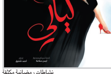
نشطاء مرضانية متكفة