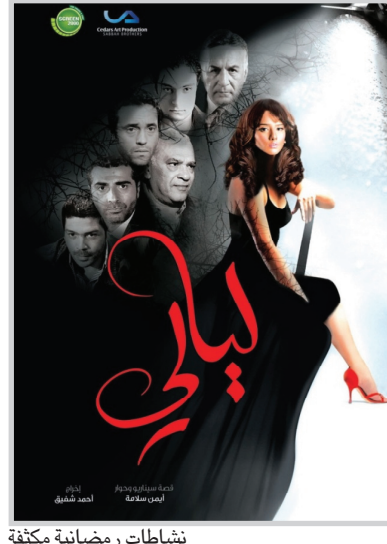
نشطاء مرضانية متكفة