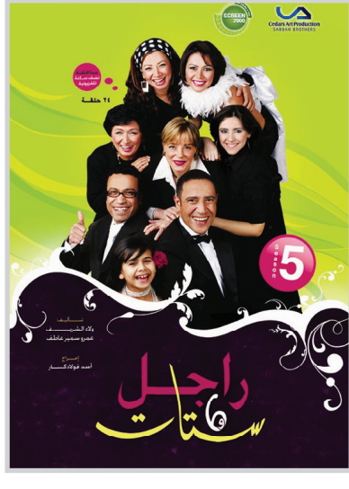
نشطاء مرضانية متكفة

سوققدم السورية برامج متنوعة أخرى تشتمل على: برنامج ألعاب شبابي وترفيهي مباشر على الهواء يقدم من أستوديو القناة السورية يتختم بالوعات غنائية واستعراضية خلاقة تضفي على البرنامج جوا من التسلية مدته ٧٥ دقيقة. إضافة إلى باقة من الرسوم المتحركة، والأفلام المخصصة للأطفال، خاص لمشاهدي القناة السورية الصغار منهم في شهر رمضان الكريم، وأحداث قرآنية توجيهية (كارتون) إلى جانب آيات قرآنية وأحداث دينية.