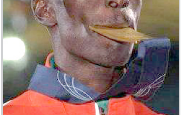
العلاء الكيني ازيكيل كيمبوي

وبعد الإعلان عن الأرقام التي سجلت في الأيام الثلاثة الأولى من المسابقة، قال بيير فايس السكرتير العام للاتحاد إن موقع الاتحاد سجل رقما قياسيا في عدد الزوار خلال يوم السبت الماضي الذي انطلقت فيه فعاليات البطولة، مؤكدا أن عدد الزوار يزداد يوما بعد يوم.