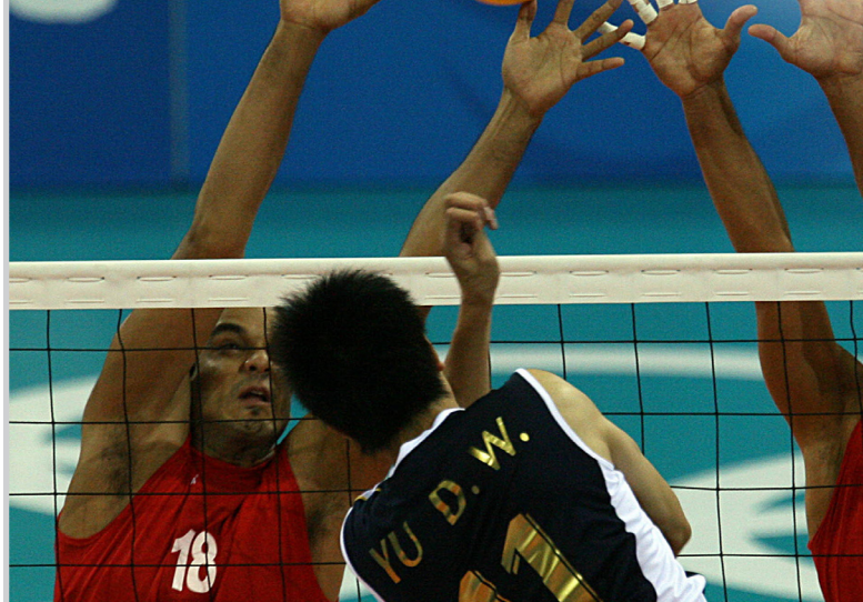
الطائرة الغربية لم تصمد أمام القوة النيجيرية

وفاز أرسنال في اللقاء البريطاني الخالص الذي جمعه بسلتيك الأسكتلندي ٢/صفر كما تغلب شتوتجارت على تيميشوارا الروماني ٢/صفر وأولمبياكوس على تيراسبول في مولدوفا بالنتيجة نفسها.