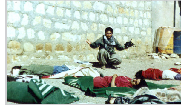
جانب من جريمة حلبجة