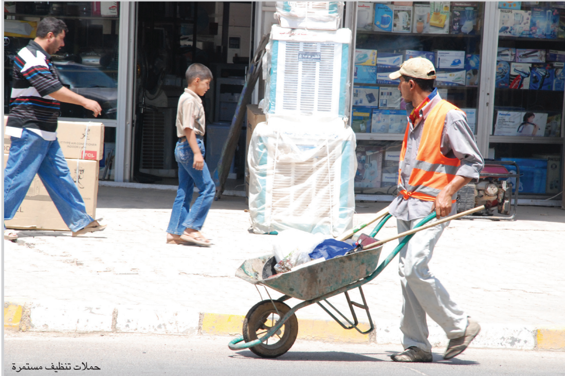
حملات تنظيف مستمرة