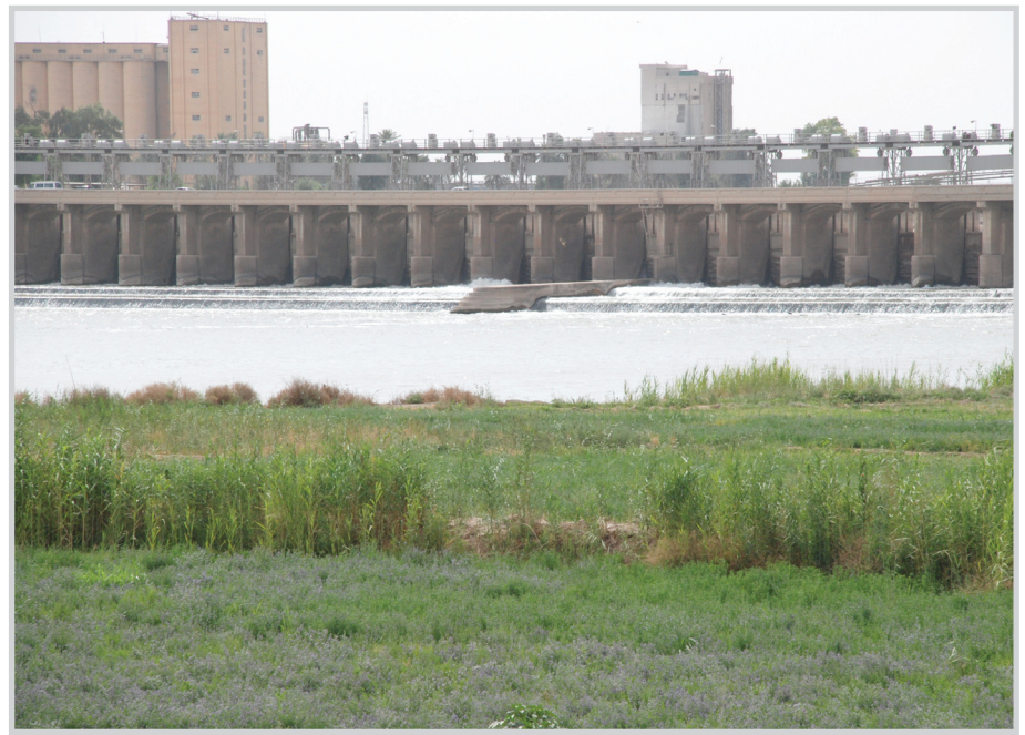
انخفاض مناسيب المياه