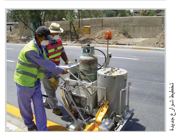
تخطيط شوارع جديدة