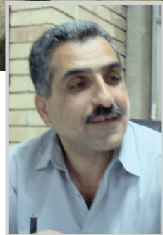
زعيم علوان داود