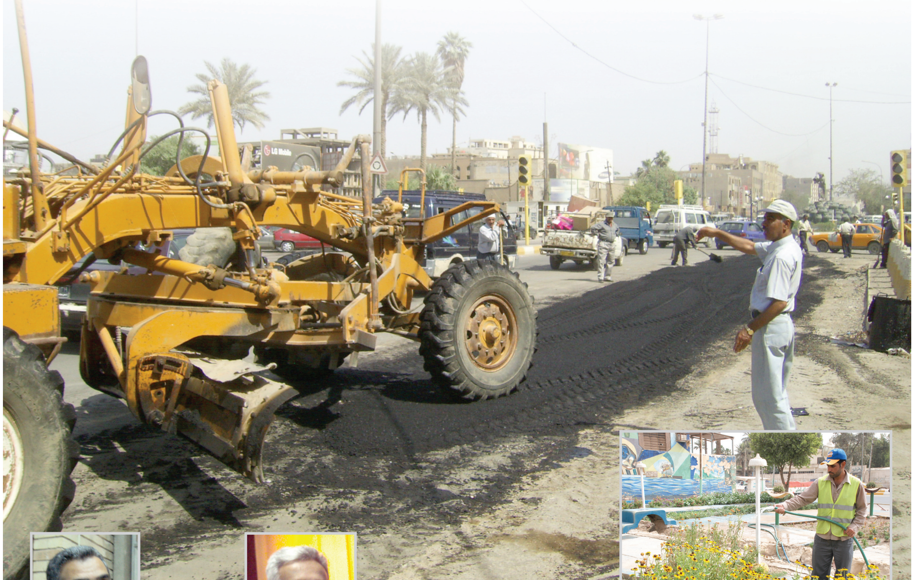
تبليط شوارع اشعاء منتزهات