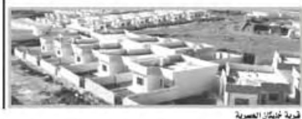
قرية نيجران العصرية شيدت محافظة دهوك في العقد الماضي تجليات على جمع الأصدقاء نتيجة اتفاقها مع عمود كردستان من السلطة السابقة ومن أجل التعرف على طبيعة هذه التجليات كان لمراد السيد نجيرفان أحمد محافظ دهوك في مكتبه يميني المحافظة وأجانباً متفصلاً على أسئلة التي ابتدأها معه بسؤال عام.

أجرى الحوار: أحمد السعداوي كيف تخشون وضع لعام محافظة دهوك؟ دهوك لا أحد يستطيع وصف دهوك أفضل من الذين يزورونها والذين كانت لهم معرفة سابقة بها.. يستطيع هؤلاء تلمس كثير من الصعوبات في محافظة دهوك تطورت بسرعة فائقة، وكان لأجواء الحرية والديمقراطية التي ظلت عموم كردستان خلال الـ (12) سنة الماضية السبب الرئيس في هذا النمو