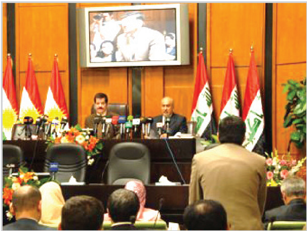
البرلمان يعقد أولى جلساته

بعد ذلك عرض رئيس برلمان كردستان الفقرة الثالثة من برنامج عمل الجلسة، المتضمنة بمقتضى تعديل المادة ٣٨ الفقرة الثالثة من المادة ٣٩ من قانون النظام الداخلي للبرلمان المرقم ١ لسنة ١٩٩٢ المعدل. ثم تلا رئيس البرلمان نص مشروع قرار التعديل السادس للنظام الداخلي للبرلمان كردستان - العراق المرقم (١) لسنة ١٩٩٢ المعدل.