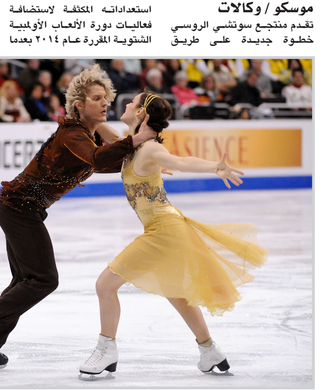
مسكو / وكالات تقدم منتج سوتشي الروسي خطوة جديدة على طريق

ومقررة تقوم منظمة الأغذية والزراعة للأمم المتحدة (الفاو) ومقرها روما، بمنح الألقاب لأصحابها رسميا في ١٦ أكتوبر/تشرين الاول المقبل بمناسبة الاحتفال بيوم الغذاء العالمي، في العاصمة الإيطالية روما.