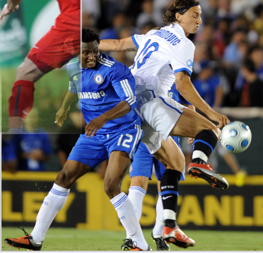
ابراهيموفيتش اخفق في ترجمة الفرص لصالح برشلونة

خارج المنطق، إلى فوز بثلاثة اهداف للنيجيري ايتاندا يوسف (٧١) والبرازيلي غيرسون ماغراو (٧٩) وأوليف غوسيف (٨٥). وفي المجموعة الخامسة، عانى ليفربول الانكليزي الامر من ملعبه انجيل رود للتغلب على ضيفه ديريتاش الجري ١-٠. صفر. وانتظر ليفربول الدقيقة ٤٥ لتسجيل هدف الفوز عندما تلاعب الإسباني فرناندو توريس بالدفاع الجري وسدد كرة قوية ارتدت من الحارس لتجد الهولندي ديرك كاوت الذي تابعها داخل المرمى.