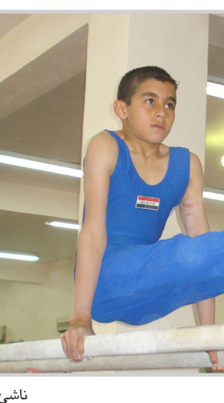
ناشئ يؤدي فاعليته بالجمناستك