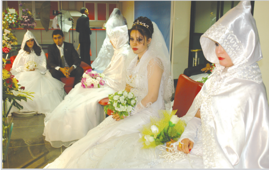
احدى صديقاتي في البصرة التي اختارت الزواج في العيد أيضاً

قالت: البصرة اليوم هي غير ماكانت عليه قبل عام، فالأمان في كل مكان، وبالإمكان الاستمرار في الحياة، وبالفعل نمارس حياتنا بالشكل الذي نريد، واخترت الزواج في هذا اليوم المبارك لأنهي حياة الوحدة والشعور بالعنوسة. وأتملت حديثها: لست أنا وحدي تزوجت وإنما أختي أيضاً تزوجت، وحالات الزواج في البصرة باتت ظاهرة يومية، سواء في الفنادق أم في البيوت، وهناك عرسان يذهبون الى بغداد للزواج فيها او الى كردستان في مصايفها. والقادمون من كردستان في رحلة الاصطيف، أسدوا كثرة حالات الزواج سواء من سكنة كردستان أم من بغداد والمحافظات، مستغربين جمال الطبيعة، وهدوء الجو ولطافته. وتستمر حالات الزواج في كل مكان من العراق للبرهان على ان الحياة لن تتوقف وإنما تسير سيرها الصحيح، برغم كل الظروف مهما كانت صعبة.