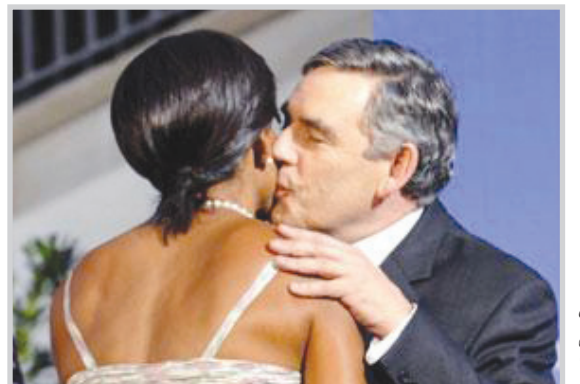
براون يعانق اوباما

دسمة لوسائل الاعلام، بعد مشاركته في قمة العشرين في مدينة "بيتسبرغ" الأمريكية، أمام حشد من أنصاره في مدينة "ميلانو" الأحد: "أحمل إليكم تحيات شخص يدعى.. شخص أكسبه التعرض للشمس سمرة (tanned).. باراك أوباما". وأضاف: "لن تصدقوا ذلك.. لكنهما يأخذان حمام شمس في الشاطئ معاً.. حتى زوجته أكسبها التعرض للشمس سمرة".