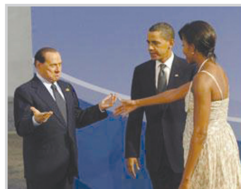
اوباما تصافح برلسكوني