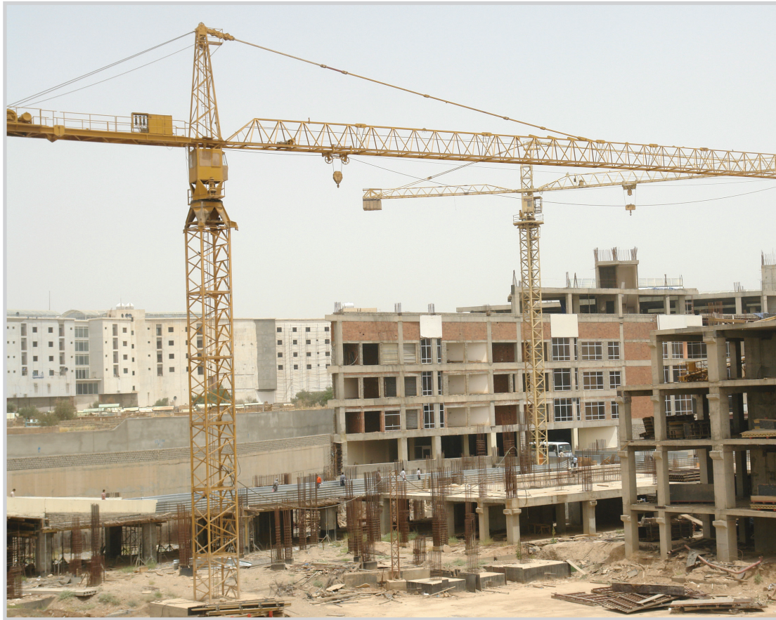
مشاريع اعمارية في طور التنفيذ