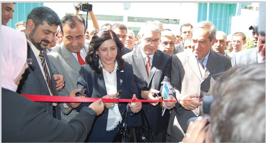
وزيرة الاسكان تفتتح معرض الانشاءات

افتتحت وزيرة الاعمار والسكان الهندسة بيان نزه بي معرض الانشاءات والمكائن ومواد البناء والكهرباء التركي الذي تنظمته شركة FORUM للمعارض والتطوير على ارض معرض بغداد الدولي وبرعاية الشركة العامة للمعارض التابعة في وزارة التجارة وبمشاركة ٦٥ شركة تركية.