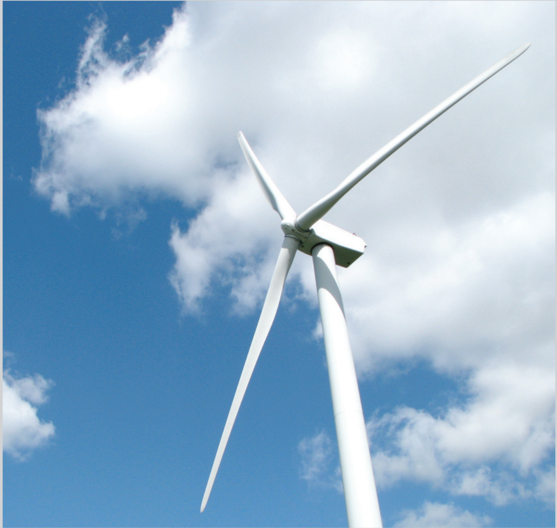
طاحونة هوائية (صور من الارشيف)

وحساسة عند المصابين بأمراض الجهاز التنفسي . وأشار رئيس اللجنة الاقتصادية الذي عمل نحو 17 عاما في مجال مكافحة التصحر، الى ان الفكرة الأساسية في المشروع تعتمد استثمار الرياح المصاحبة للعواصف الترابية في مكافحة التصحر وذلك عبر استخدام الرياح في توليد طاقة كهربائية رخيصة وغير ملوثة للبيئة من شأنها ان تسهم بإنشاء احزمة خضراء في مناطق صحراوية متاخمة للمدن. لافتا الى نجاح عدة تجارب مماثلة في بلدان مختلفة من بينها مصر التي أنشأت مزارع متعددة تعرف بمزارع المراوح .