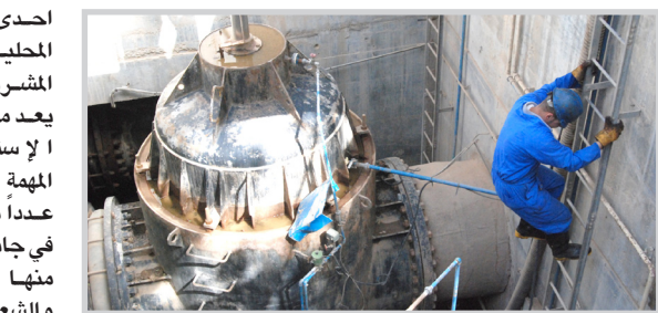
بلديات الصدر الاولى والثانية و٩ نيسان (٤٠)٪ في تنفيذ اعمال التوسيع الثاني لمشروع شرق دجلة بكلفة (٣٨) مليار دينار وبسقف زمني مدته (٢٤) شهرا. ونذكر المكتب الاعلامي لأمانة بغداد إن الملاكات الفنية والهندسية لادارة ماء بغداد احد تشكيلات امانة بغداد تواصل بالتعاون مع

احدى الشركات المحلية تنفيذ المشروع الذي يعد من المشاريع الاستراتيجية المهمة التي تخدم عددا من المناطق في جانب الرصافة منها الأعظمية والشعب وسبع أبنكار وأجزاء من بلدات الصدر الاولى والثانية و٩ نيسان (٤٠)٪ في تنفيذ اعمال التوسيع الثاني لمشروع شرق دجلة بكلفة (٣٨) مليار دينار وبسقف زمني مدته (٢٤) شهرا. ونذكر المكتب الاعلامي لأمانة بغداد إن الملاكات الفنية والهندسية لادارة ماء بغداد احد تشكيلات امانة بغداد تواصل بالتعاون مع