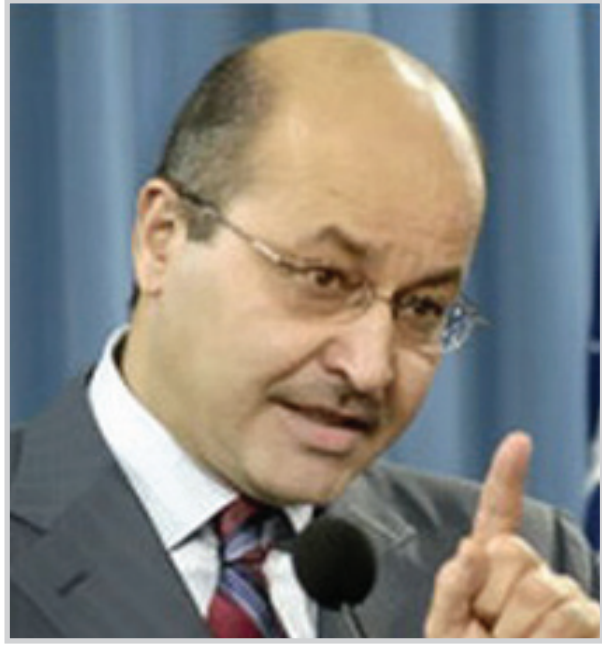
د. برهم صالح

اربييل/سالي جودت أكد الدكتور برهم صالح العمل من أجل تحقيق أفضل الخدمات لمواطني الإقليم من خلال حرصه وأعضاء الحكومة التي سيتم تشكيلها على تحقيق برامج القائمة الكردستانية . وأعرب خلال مؤتمر صحفي في مصيف صلاح الدين عقب تكليفه برئاسة الحكومة من قبل رئيس اقليم كردستان مسعود بارزاني عن شكره لرئيس الإقليم وحرصه على اداء المهام الوطنية والسياسية التي كلف بها لتشكيل الكابينة السادسة أملا النجاح في مهامه، وان يكون عند حسن ظن وثقة برلمان كردستان والجمهور. وقال صالح انه سيبدأ قريباً بأجراء مفاوضات مع جميع