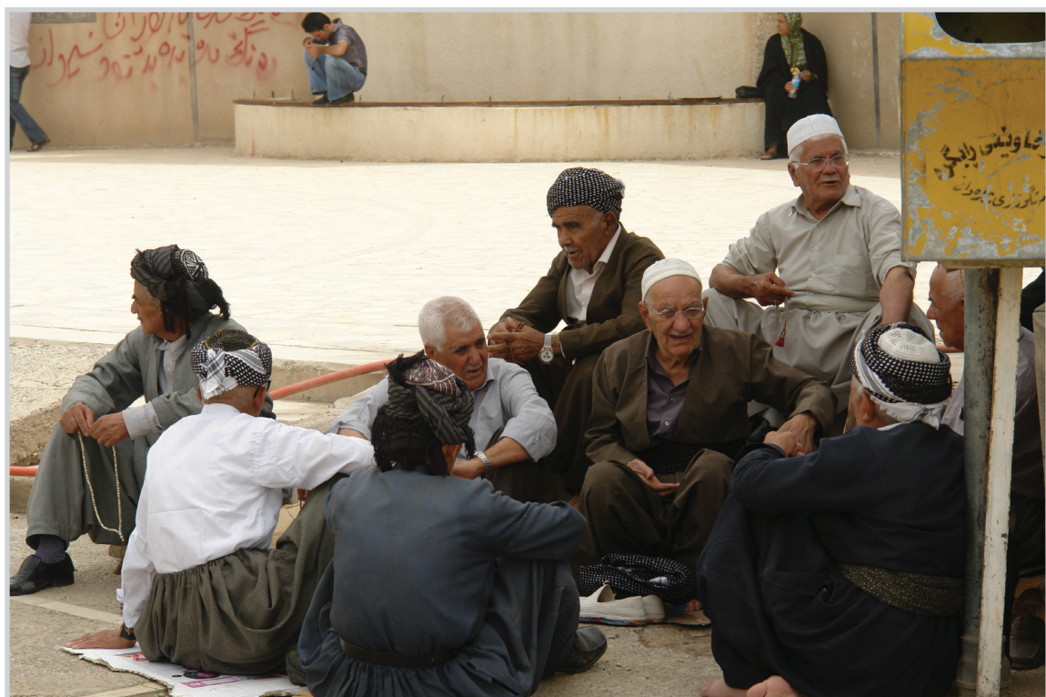
مسنون على قارة الطريق