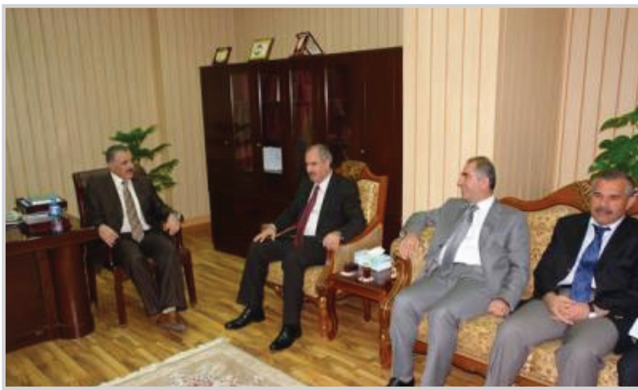
د. ارسلان بايز مع وفد حكومي

اربييل / المدى بحث نائب برلمان كردستان د. ارسلان بايز مع وفد من حكومة الإقليم برئاسة عماد احمد نائب رئيس مجلس الوزراء عددا من القضايا من أبرزها سبل واليات التنسيق والتعاون بين لجان البرلمان والوزارات بما يحقق أفضل الخدمات للمواطنين ، حيث استقبل نائب رئيس البرلمان في مكتبه بمبنى البرلمان عماد احمد نائب رئيس حكومة إقليم كردستان ود.بلشاد عبدالرحمن وزير التربية في حكومة الإقليم وعدنان محمد قادر مدير العمل والشؤون الاجتماعية وعثمان شواني وزير التخطيط ومحمود ستكاوي العضو القيادي للاتحاد الوطني الكردستاني. وقد كل من عماد احمد نائب رئيس الحكومة ود.بلشاد عبدالرحمن وزير التربية خلال اللقاء وبحسب موقع حكومة الاقليم النهائي لنائب رئيس البرلمان، متعين له النجاح والتوفيق، ثم جرى التطرق الى دور وهام البرلمان في المرحلة القادمة والتنسيق والتعاون بين اللجان