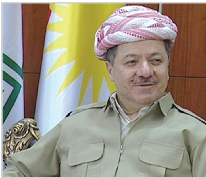
رئيس إقليم كردستان