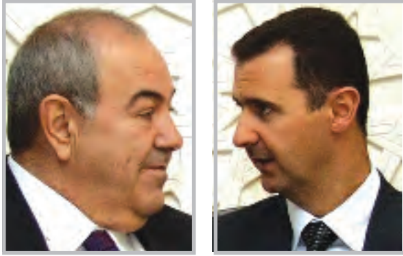
من جهته قال العطرى (اتفقا على تشكيل لجنة تنسيق امنية مشتركة لضبط الحدود من والى العراق).

دمشق (ا ف ب) اتفق العراق وسوريا على تشكيل لجنة امنية مشتركة مكلفة ضبط الحدود بين البلدين كما اعلن امس السبت رئيسا الوزراء السوري محمد ناجي العطرى والعراقي اباد علاوي خلال مؤتمر صحافي عقدهما في دمشق.