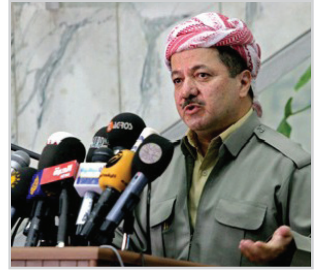
رئيس إقليم كردستان