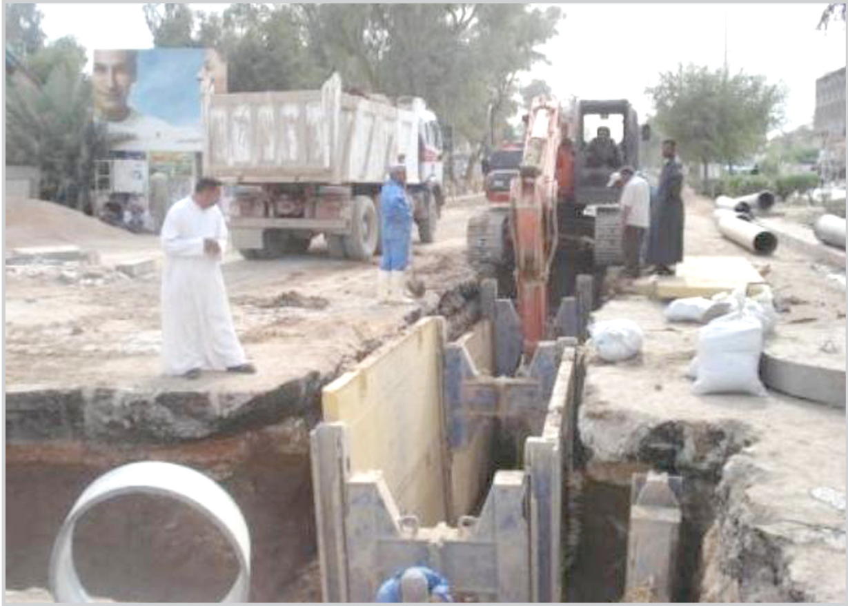
مشاريع خدمية دائمة..

حلم طالما راودنا برؤية . مدينة متطورة بنيات شاهقة وحدائق زاهية تسر الناظر، وجسور كبيرة تنقلك من ضفة لآخرى دونما زحام، وطرق معبدة وشبكات مياه ومجار (سائلة)، وتيار كهرباء لا ينقطع على مدار اليوم.