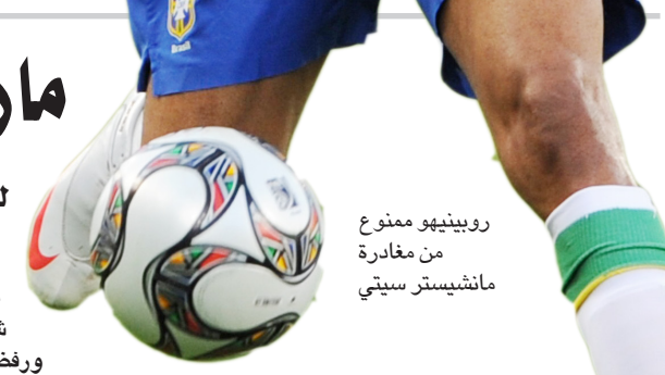
روبينيو ممنوع من مغادرة مانشستر سيتي

وفي الدقيقة ٢٨ تلقى البرازيلي أليكس تيكسييرا كرة طويلة هبها لنفسه بيده داخل منطقة الجزاء ثم سدها وتصدى لها الحارس الغاني، وأشهر حكم المباراة فرانك دي بليكر البطاقة الصفراء في وجه تيكسييرا للمس الكرة بيده. وبعدها هدأت مجريات اللعب وتراجعت