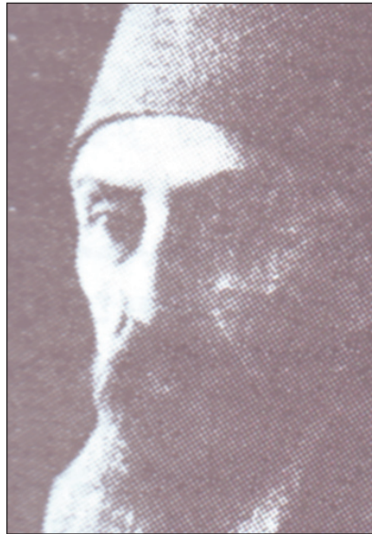
السلطان في صورة له عام ١٩٠٨

في عام ١٨٧٢ عين (مدحت باشا) الذي كان واليا على (بلغاريا) ثم (بغداد) حيث اجري اصلاحات كثيرة، بمنصب الصدر الاعظم (رئيس الوزراء) في عهد السلطان عبدالعزيز ولم يلبث ان قاد ثورة عام ١٨٧٦ ادت الى مجيء مراد الخامس للسلطنة ولم يلبث مدحت باشا ان اسقطه بعد اشهر قلائل من ارتقائه العرش لاصابته بلوثة عقلية لمصلحة شقيقه عبدالحميد الثاني (١٨٤٢-١٩١٨) .. بعد ذلك استطاع الصدر الاعظم اقتناع السلطان الجديد على منح اول دستور في التاريخ التركي ولكن عبدالحميد اقاله بعد ان ثبت اقدامه على العرش واقاله ثم ارسل به الى اعماق السجن بتهمة قتله السلطان عبدالعزيز ولم يلبث مدحت ان مات في السجن مخنوقا وذلك عام ١٨٨٤ ..