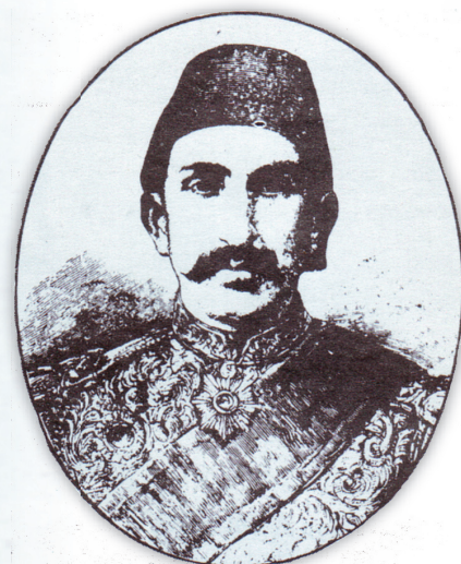
عبد الحميد في شبابه

ما دور الماسونية في اسقاط السلطان عبد الحميد؟