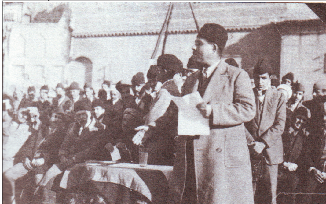
الرصافي خطيبا في مدرسة التقيض

اما كيف حدث ذلك فالى القارئ التفصيل: قال المرحوم حكمت: كانت بيني وبين جاويد باشا والي بغداد صداقة، فكنت ازوره في داره مساء كل يوم.