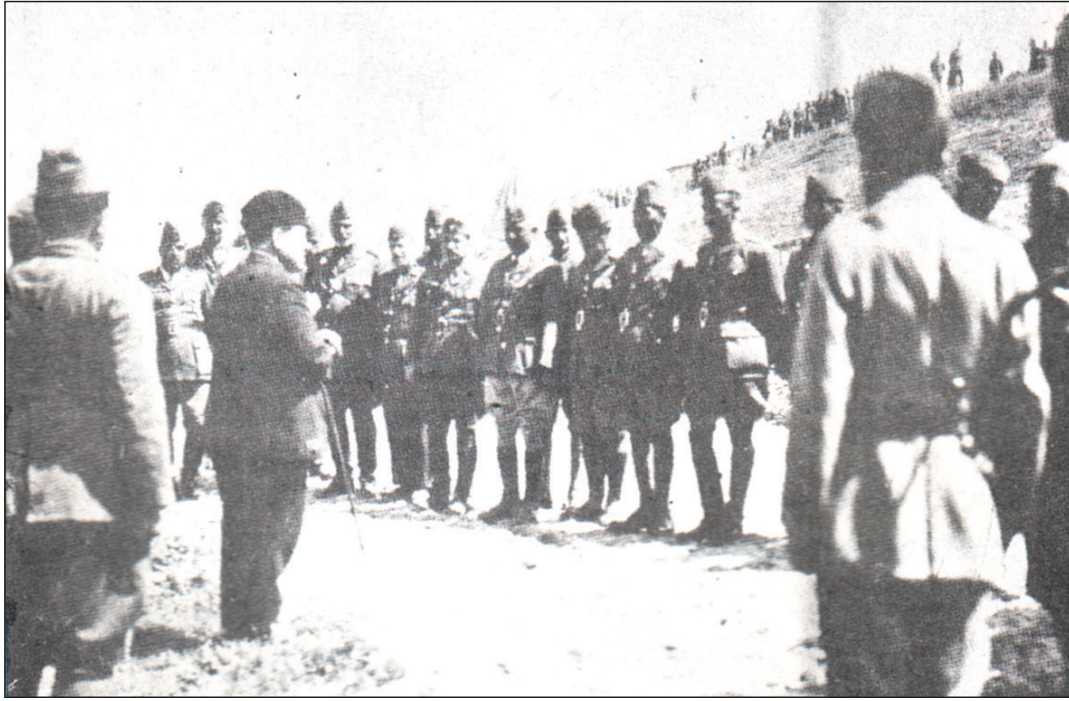
جعفر العسكري قبل مقتله بساعات

وقال لي ايضا ان نوري السعيد وجعفر العسكري كانا يعتزلمان القيام بانقلاب عسكري ضد وزارة ياسين الهاشمي وقد ابلغ رؤساء العشائر الذين اتصلا بهم لهذا الغرض (الميجر ادمونزر) مستشار وزارة الداخلية فنصحهما بالعدول عن ذلك ولكنها استمرا في العمل لان طموح الكيلاني لم يكن ينتهي عند حد فلقد كان يشجع الملك غازي خلال مدة نيابته عن ابيه الملك فيصل الاول ليسلك المسالك التي تثير غضب بريطانيا .