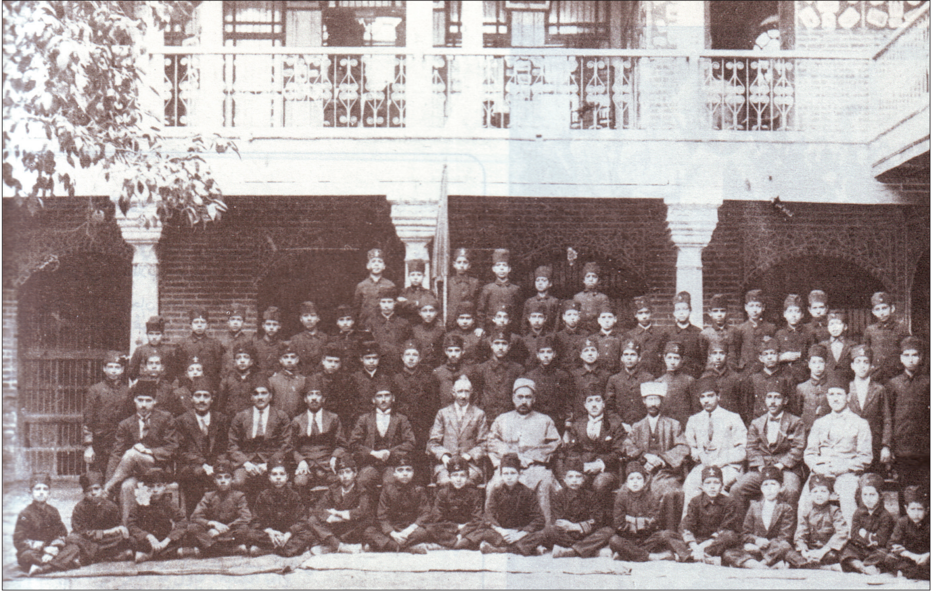
اول مدرسة متوسطة في بغداد