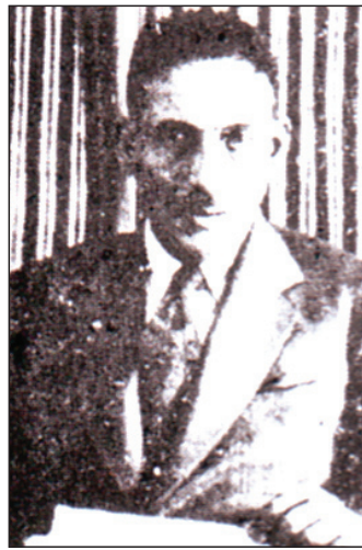
عبد المحسن السعدون