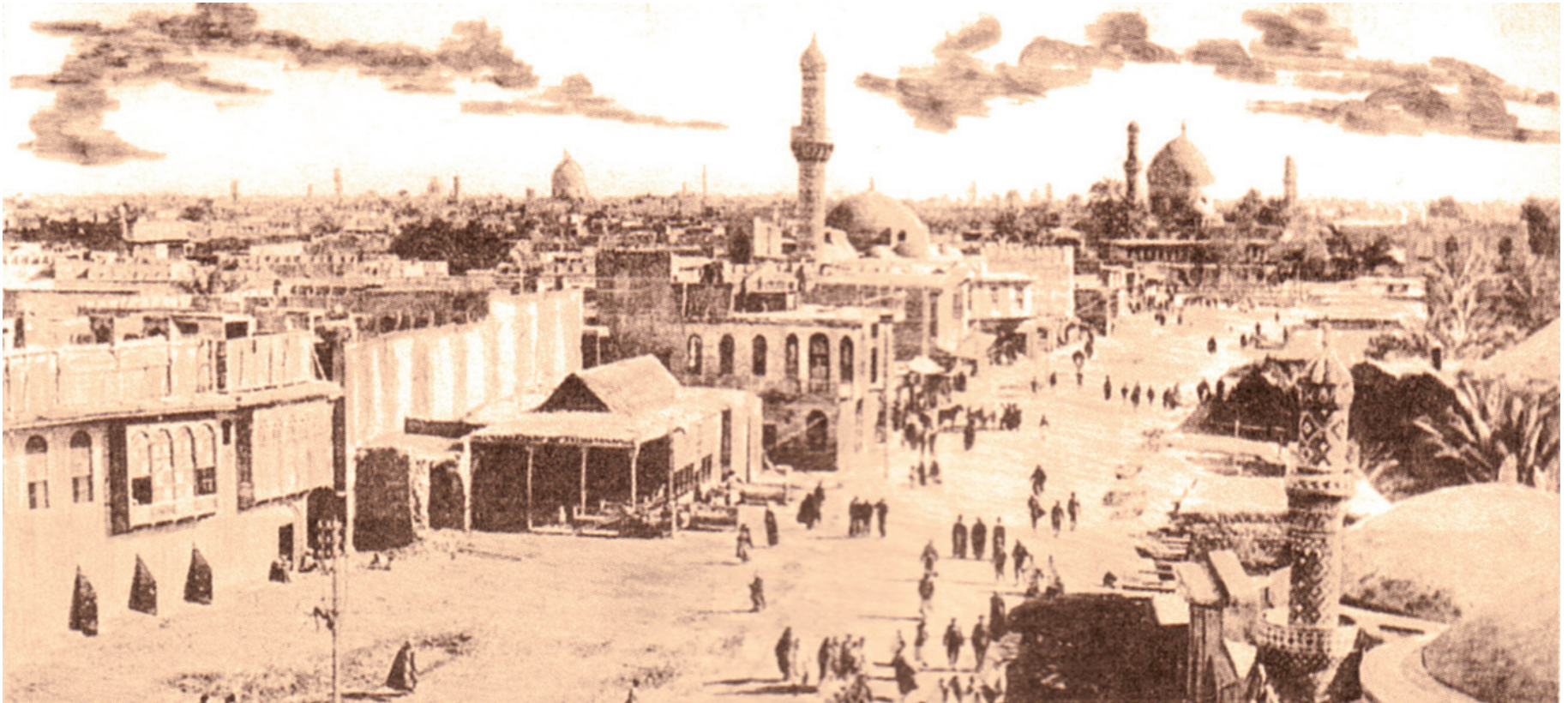
بغداد في سنة ١٩١٧

نشرت الصحف العراقية بين عامي 1917 و 1929 عددا من الاعلانات ننشر بعضا منها لاهميتها في التعرف على تاريخ العراق المعاصر