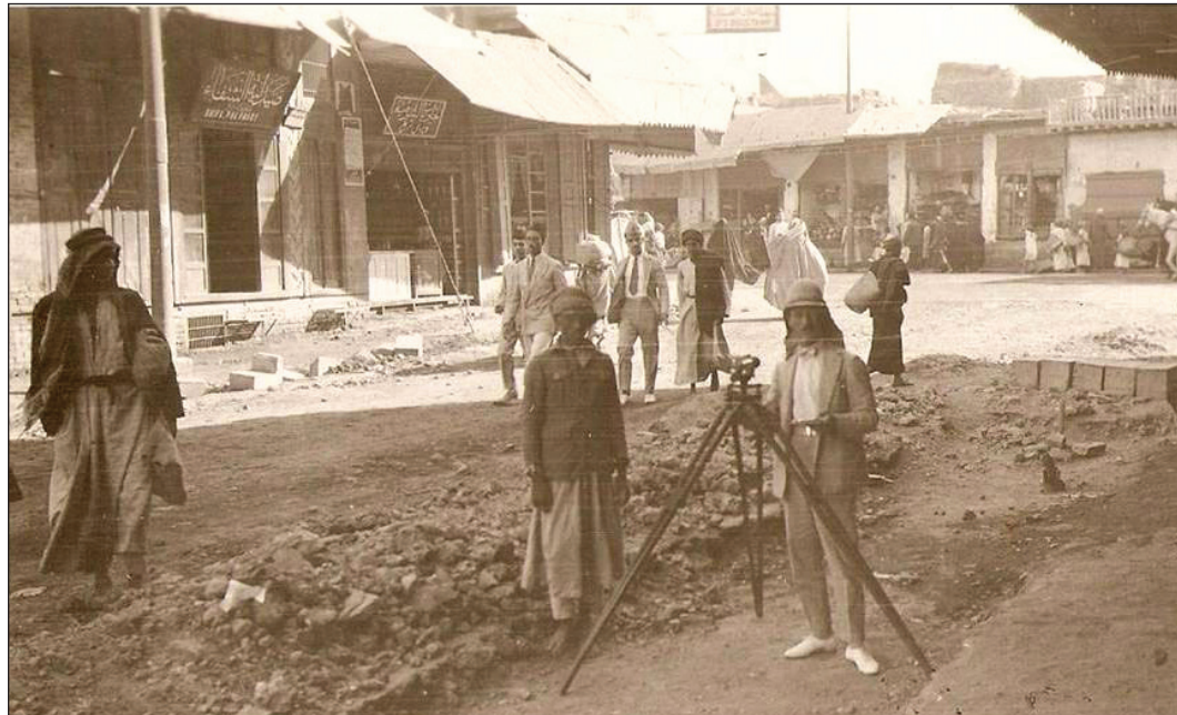
افتتاح شارع المأمون ١٩٢٢

الجسر التي جاءت على مايرام.. ومازال الناس يفدون افواجا اطلاقا على اثر بعضهم حتى غربت الشمس. وفي يوم السبت اصبح الجسر مطلق العبور للاهالي وما يجدر بالذكر سرعة الفتح والسد التي امتاز بها هذا الجسر على غيره.