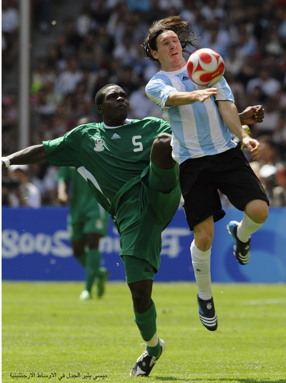
ميسي يثير الجدل في الأوساط الأرجنتينية

رغم اعلانه ضمن قائمة المرشحين للاعب الافضل في العالم