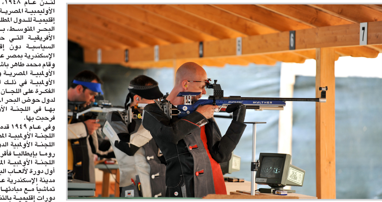
جانب من إحدى مسابقات دورة ألعاب البحر المتوسط

القاهرة/وكالات وافق مجلس إدارة اللجنة الأولمبية المصرية، على التقدم بطلب ترشيح لاستضافة دورة ألعاب البحر