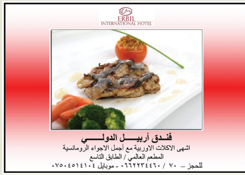
فندق أربيل الدولي شبه الاكلات الأروبية مع أجمل الأجواء الرومانسية المطعم الملكي / الطابق التاسع الهاتف: ٠٧٥٠٤٥١٤١٠٤ / الفاكس: ٠٧٥٠٢٢٢٢٤٤٦٠ / البريد الإلكتروني: info@arbilhotels.com