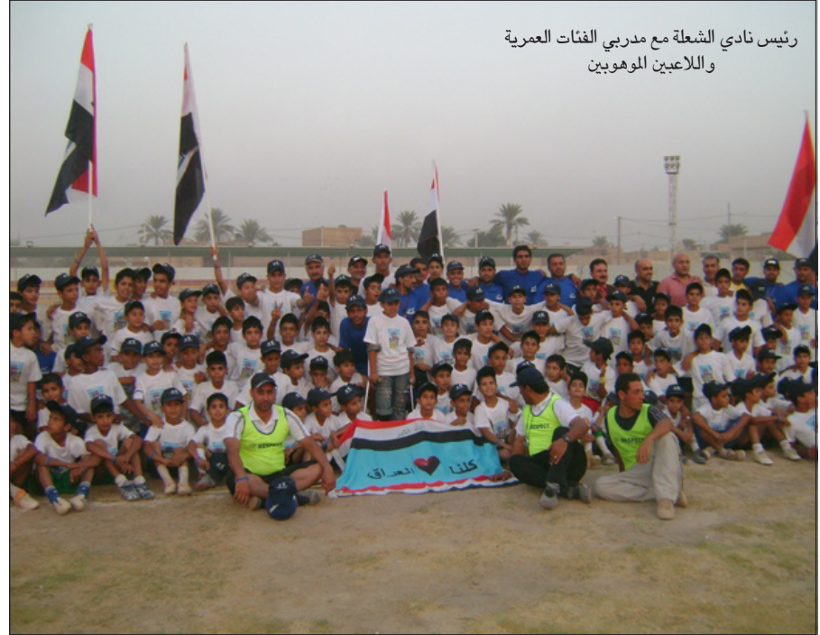
رئيس نادي الشعلة مع مدربي الفئات العمرية واللاعبين الموهوبين