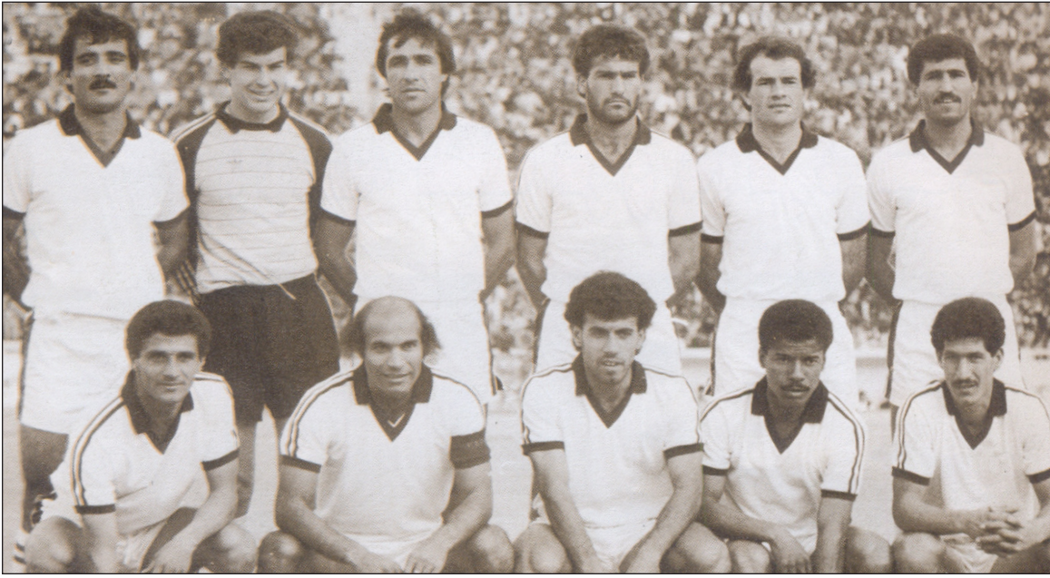
عميد هجوم الزوراء وسط كوكبة من الشباب عام ١٩٩٠

هناك نجوم قلائل يصمدون في ذاكرة الناس على مدى طويل من الزمن، لكونهم يتركون أثرا طيبا خلفهم من خلال البصمات العديدة التي يقدمونها فوق المستطيل الأخضر الذي كافأهم بالخلود الطويل في ذاكرة الجمهور الرياضي. في زاوية (نجوم في الذاكرة) سنحاول الغور في مسيرة أحد نجوم المنتخبات العراقية السابقين الذين ترفض ذاكرة جمهورنا مغادرتهم لها، حيث صمدوا في البقاء فيها برغم مرور عقود عدة على اعتزالهم اللعب وحتى قسم منهم ابتعدوا عن الرياضة برمتها أو غادروا العراق إلى بلدان أخرى.