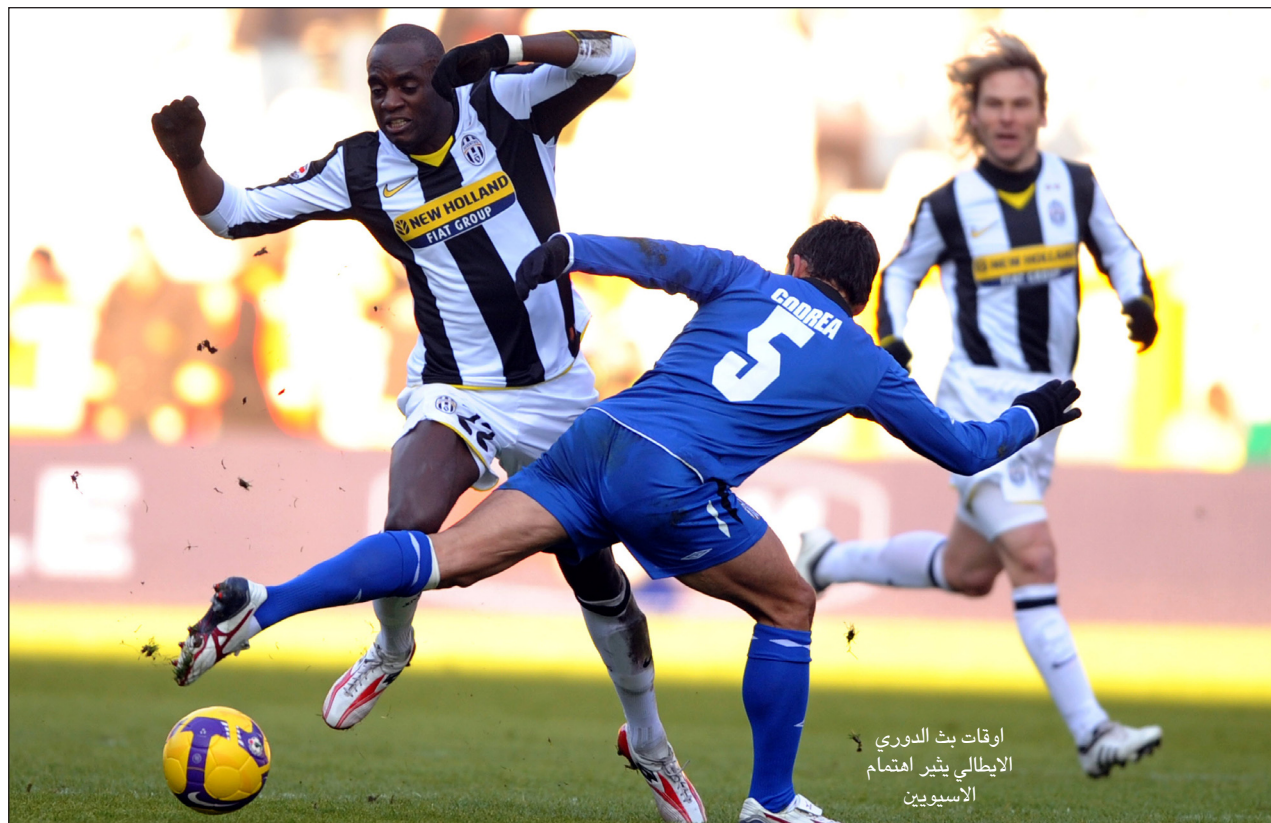
اوقات بث الدوري الايطالي يثير اهتمام الآسيويين

وقال مسؤولون خلال مؤتمر دولي بخصوص حقوق البث الدولية لمباريات كرة القدم، أنهم يأملون العثور على مشتر واحد لجميع الحقوق الدولية حتى يمكن السيطرة على الوضع وفي الوقت نفسه تكون هناك أقصى مرونة في المفاوضات والترح. وكشف المسؤولون عن أن الفائز بالعرض يحق له أن يكون قادرا على بيع تراخيص فرعية لكل بلد تمشيا وطبقا للشروط العامة التي توضح أن الحد الأدنى للنقل يشتمل على مباراتين أسبوعيا. وأضافوا: «أولويتنا هي تحسين الرؤية ووجهات النظر على منافسات «الكالتشيو» في جميع أنحاء العالم وذلك من أجل تحسين العائدات».