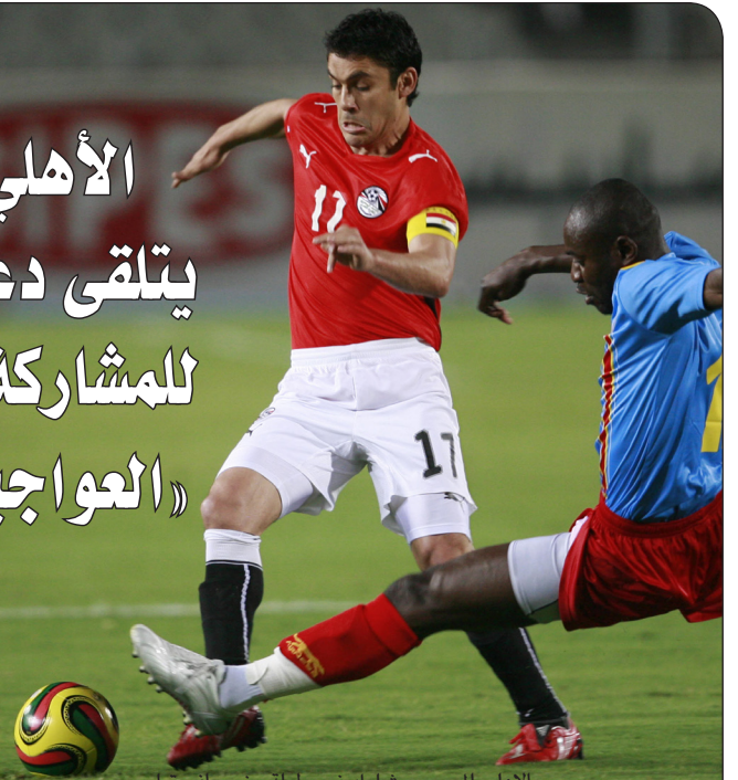
الأهلي المصري يشارك في بطولة جنوب أفريقيا