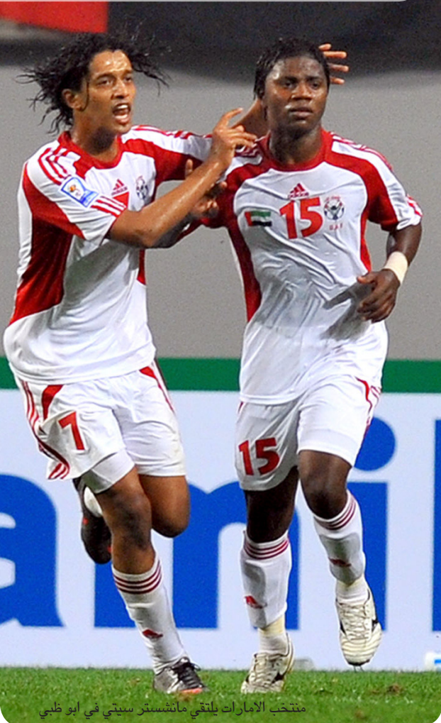
منتخب الإمارات يلتقي مانشستر سيتي في ابوظبي