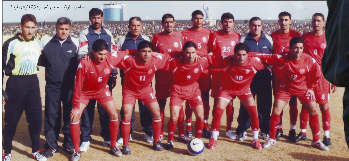
سامراء ارتبط مع يونس بعبارة فنية وطيدة