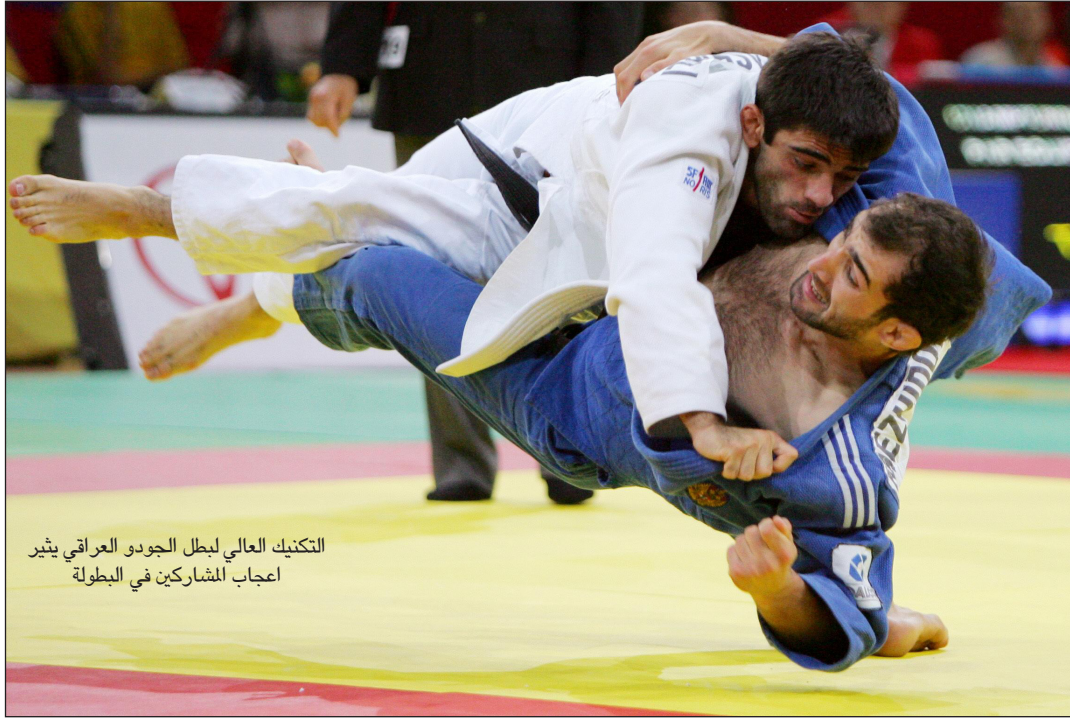
التكنيك العالي لبطل الجودو العراقي يثير اعجاب المشاركين في البطولة

واستغرب علي من سوء تنظيم البطولة الذي لا يمت بأية صلة لبطولة بهذا الحجم والمستوى فقد افترقت الى كل مقومات النجاح من توفير مياه الشرب الى الاماكن المخصصة للجلوس الى توفير الاجواء الملائمة للبطولة كالتقاع المخصصة للعب التي كان الجو حاراً جداً فيها ما اجبر الحاضرين على الخروج منها بين فترة واخرى لتغيير الجو .