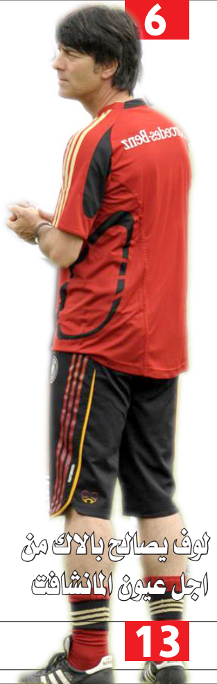
لوف يصالح بالاك من اجل عيون الانشافت