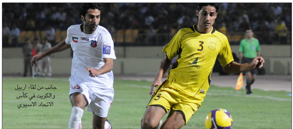
جانب من لقاء أربيل والكويت في كأس الإتحاد الآسيوي

واضاف في تصريح خص به (المدى الرياضي): إن إدارة نادي أربيل عرضت عليه الموافقة على جميع الشروط التي يقدمها مقابل توليه مهمة تدريب الفريق لكنه لم يتخذ قراراً بشأنها حتى الآن ، مشيراً إلى إنه شرف عظيم أن يكون أول مدرب سوري يدرّب في العراق منذ تأسيس الكرة العراقية.