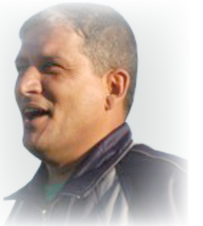
البر برونس بيجر سامراو لا