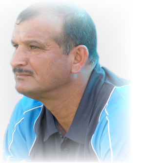
ملعب سوري بملعب (البر التمثيل)