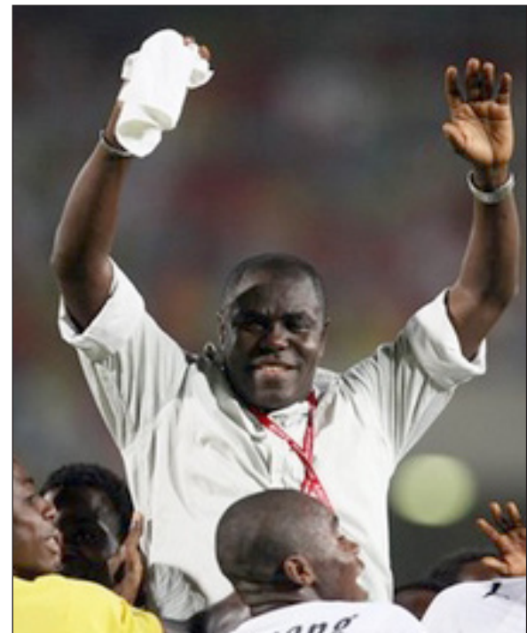
مدرب غانا فوق اكتاف لاعبيه