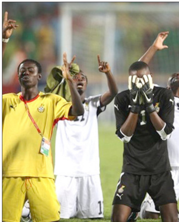
بكاء هيسيتيري فرحاً باللقب