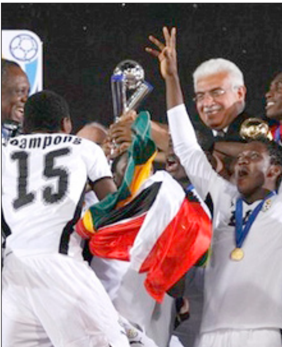
لحظة تسليم كابتن غانا كأس العالم

وحطم المونديال الرقم القياسي لعدد الأهداف المسجلة عبر تاريخ البطولة والمسجل باسم