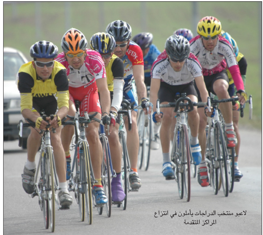
لاعبو منتخب الدراجات يأملون في انتزاع المراكز المتقدمة