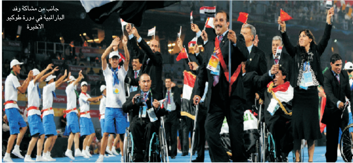
جانب من مشاكة وفد البارالمبية في دورة طوكيو الاخيرة