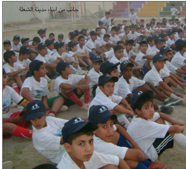
جانب من أبناء مدينة الشعلة