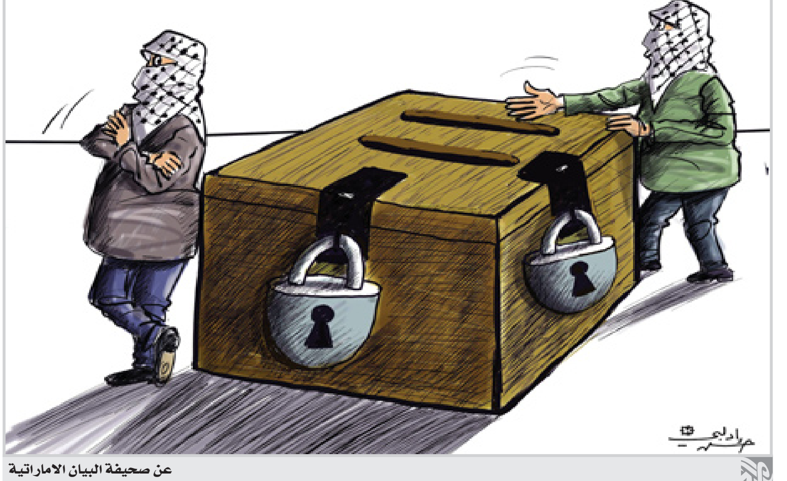
عن صحيفة البيان الاماراتية