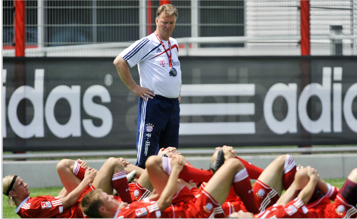
فان خال حائر في اختيار البدلاء

صدارة (كأني) وأتوقع عودة بايرن للصدارة قريباً جداً...!! هجوم بايرن مشلول × لقد دفع بايرن ميونيخ من خزينته أكثر من سبعين مليون مقابل ماريو غوميز، رويين، فارنبايد، بيتريك، ومع ذلك لم يظهر بايرن خطيراً في خط الهجوم؟ - هذا الكلام صحيح، ولدى بايرن أفضل خمسة مهاجمين وهما: ماريو غوميز، ميروسلاف كلوزه، ايفكا اوليش، توماس مولر ولوكا توني، ولكن نصف هؤلاء اللاعبين يعاني نقص اللياقة البدنية بسبب الإصابات التي تعرض لها وأجبرته على الابتعاد، وهذا الأمر دفع المدرب فان خال لإيجاد حلول تكتيكية مناسبة واعتقد أن نتاجها كانت جيدة حتى الآن ولكننا لن نتوقف عند هذه النقطة بل نفكر جدياً في العمل من أجل أن يكون بايرن في دائرة الصدارة في المباريات المقبلة، واعتقد أن الصدارة مازالت في متناول بايرن لأن فارق النقاط بين الأندية التي تحتل المراكز الأولى وحتى الثامن ليس كبيراً هامبورغ وماغات مدرب شالكه الذي يحتل المركز الثالث، كيف تعلق على ذلك؟ - أعتقد أن هذه الأندية التي تتحدث عن امتلاك القدرة على مواصلة المشوار وستتفقد مراكزها في المباريات المقبلة، وبخلاف هامبورغ وكذلك انتقال لوكا توني الى ايباتلينا... ماهي صحة هذه المقولة؟ - الأمور الفنية بيد المدرب فان خال وهو المسؤول الأول عن كل ما يتعلق بتشكيلة النادي وباللاعبين الذين يشاركون في المباريات... واستطيع القول أن بايرن لن يوافق على انتقال