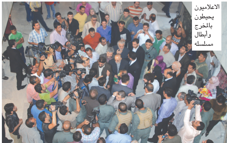
الاعلاميون يحيطون بالمخرج وأبطال مسلسله

ولاقي استحساناً في جميع البلدان الإسلامية والأجنبية... ووصلني ان طفلاً كان كلما يعرض المسلسل ويرى يوسف يقبل شائبة التفتان. وكذلك وصلني ان شيخاً في التسعين من عمره قال بعد مشاهدته المسلسل: حصلت على أجوبة كثيرة كانت تحيرني. نحن مسرورون بزيارتنا للعراق وسنكون أكثر سرورا اذا قمنا بتسريح جنود فن مشترك بين البلدين.