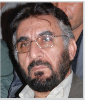
المخرج وعدد من فريق عمل المسلسل