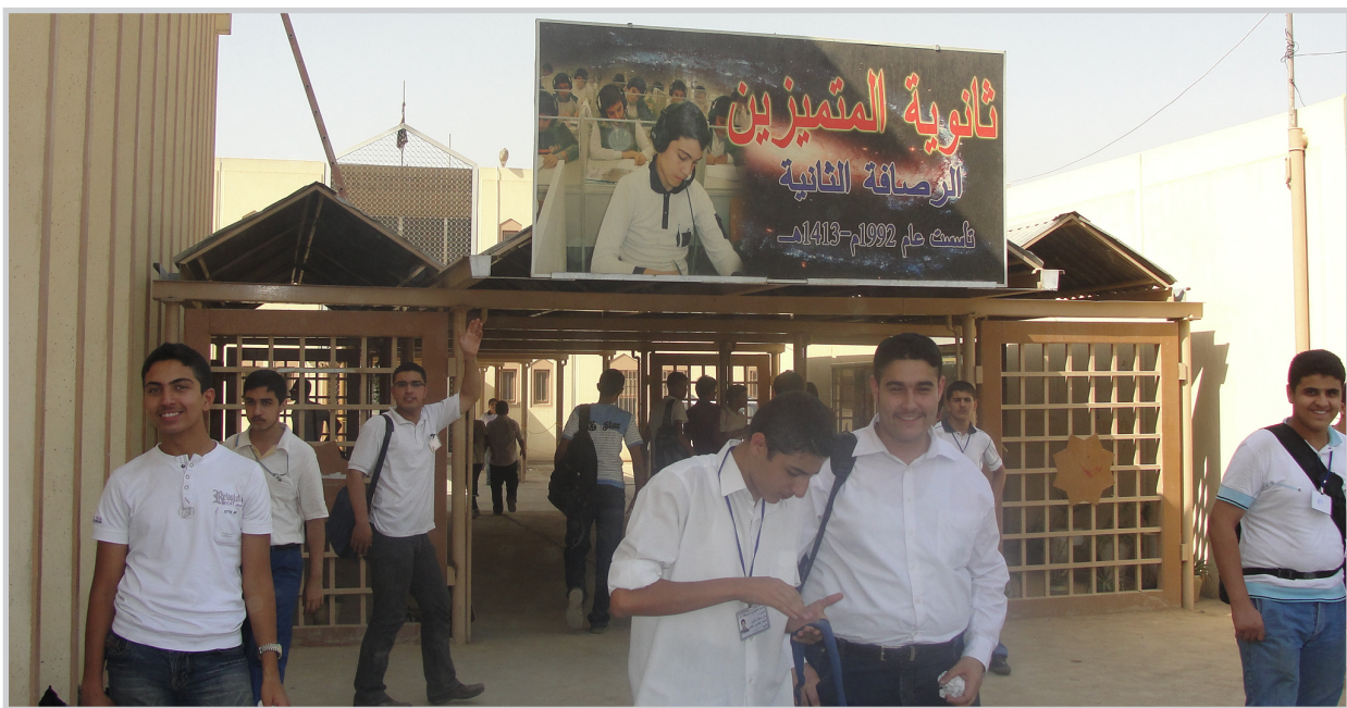
ثانوية المتميزين في الرصافة

وسجلت مديرية تربية الرصافة الثانية تأييدها لمطالب الطلاب والمدرسين المتعلقة في الحصول على الكتب بوقت مبكر وعدم التغيير من دون إنداز.