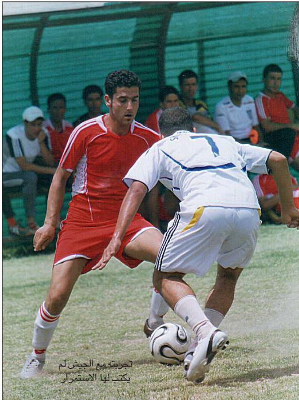
تجربته مع الجيش لم يكتب لها الاستمرار