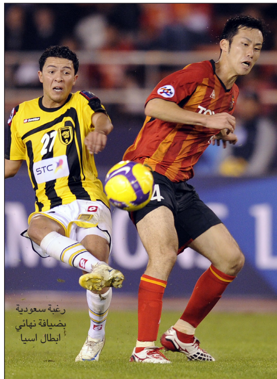
رغبة سعودية بضيافة نهائي أبطال آسيا