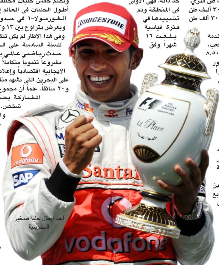
أحد أبطال حلبة صخير البحرينية

تتكون حلبة البحرين الدولية من المكونات المستخدمة في الإنشاءات المتقدمة، إذ تتكون القاعدة السفلية للمسار من ٢٧٢،٦٤٨ مترا مربعا، ويبلغ حجم طبقة الإسفلت الأولى ٦٠ ألف طن متري. وطبقة الإسفلت الثانية ٣٠ ألف طن متر، وطبقة الإسفلت الثالثة ٣٠ ألف طن متري. وتبلغ كمية السمنت المستخدمة في بناء الحلبة ٧٠ ألف متر مكعب، وتبلغ كمية المعدن المستخدم ٨.٥٠٠ طن متري وكمية الصخور المستخدمة ٩٦٨.٤٥٩ مترا مكعبا، وبلغ حجم الردم الكلي ٥٠٠ ألف متر مكعب. أما بالنسبة إلى الحواجز في الحلبة فيبلغ الطول الكلي لحواجز الإطارات ٤،١٠٠ متر، فيما يبلغ عدد الإطارات الكلية المستخدمة ٨٢ ألف إطار، حيث يبلغ الطول الكلي لحايز الحماية ١٢ ألف متر، والطول الكلي لسياج الحماية الخاصة "بالفيا" ٥ آلاف متر. واستطاعت حلبة البحرين الدولية منذ افتتاحها في السابع عشر من آذار عام ٢٠٠٤ أن ترسخ من وضعها كموطن لرياضة السيارات نظرا لمواصفاتها المميزة وطبيعتها الصحراوية وموقعها الجغرافي الاستراتيجي