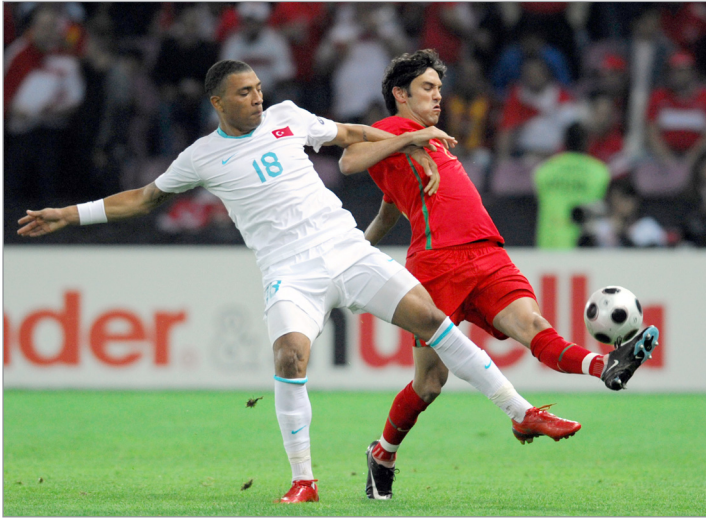
البرتغال يسعى لحسم تأهله الى كأس العالم

× تبدو مقتنعا للغاية؟ -أنا متفائل بنسبة ١٠٠٪ من تأهلنا، لا شك في ذلك.