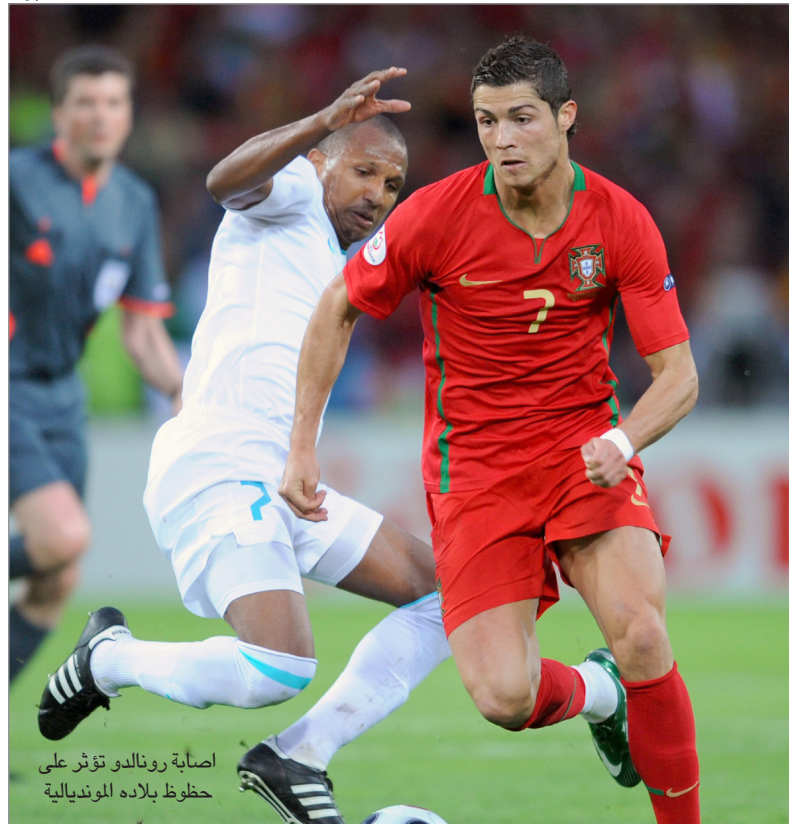
اصابة رونالدو تؤثر على حظوظ بلاده الموندالية

أن أصعب مهمة هي التأهل، وما إن يحقق منتخبنا هذا الهدف، فإنه سيكون مرشحاً للفوز للفوز