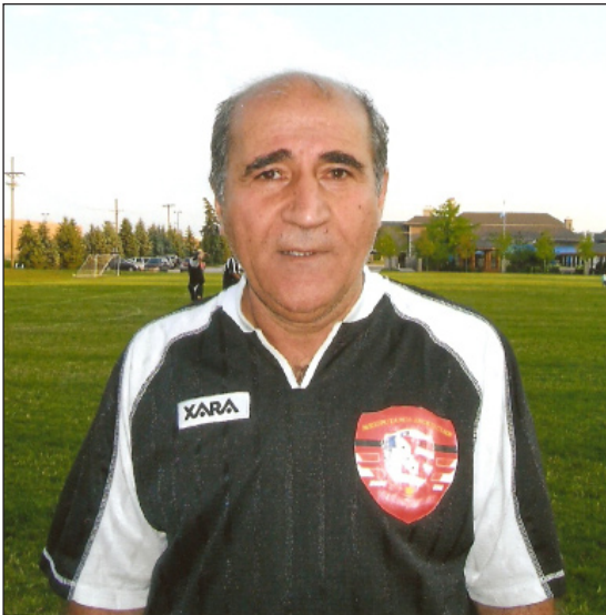
ما زال يتمتع بروحية الشباب