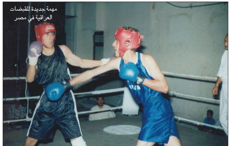
مهمة جديدة للقبضات العراقية في مصر