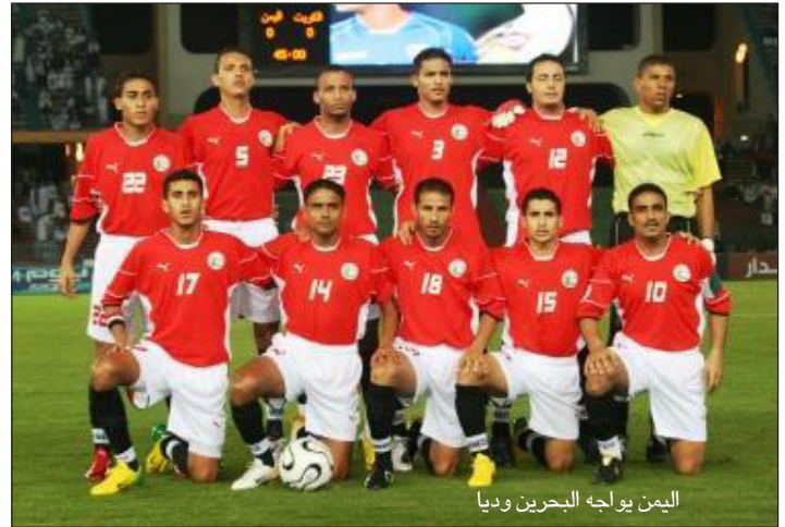
اليمن يواجه البحرين وديا