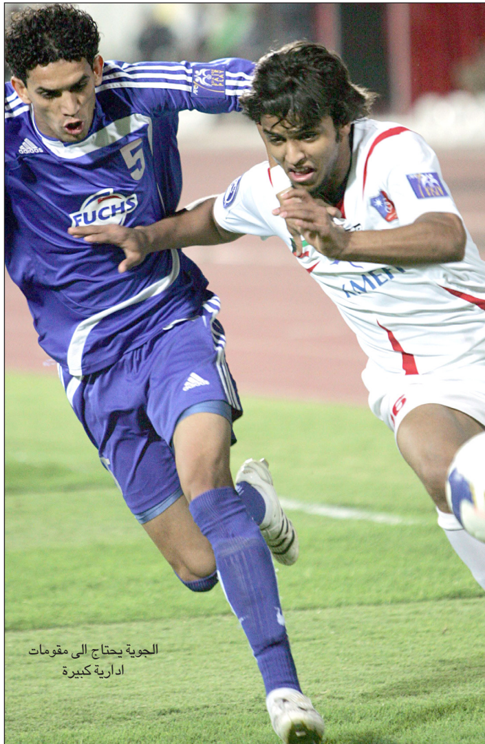
الجوية يحتاج الى مقومات ادارية كبيرة

أو الإدارة ان الجمع بين مهنتين يقلل الابداع ويؤدي الى الازدواجية في اتخاذ القرارات، وأتمنى من الجهات الرياضية ان تنصر قرارا بمنع الجمع