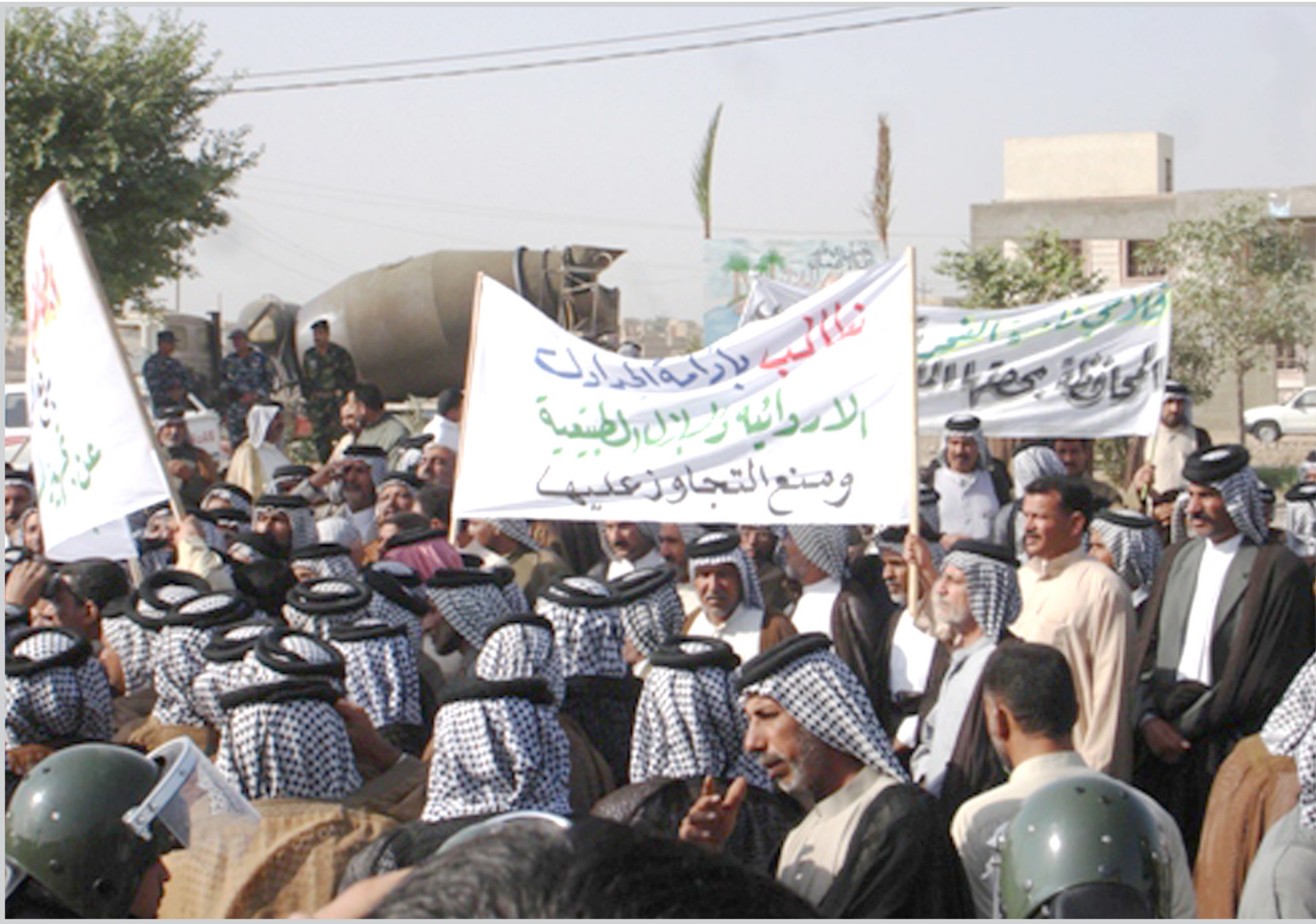
جانب من التظاهرة

والغلاية في ذي قار مقعدا الياسري ل(المدى) امس تحتشد الجماهير الغلاية اليوم للمطالبة بحلول ما تتعرض له العملية الزراعية من انتكاسة وتكؤ . و اضاف