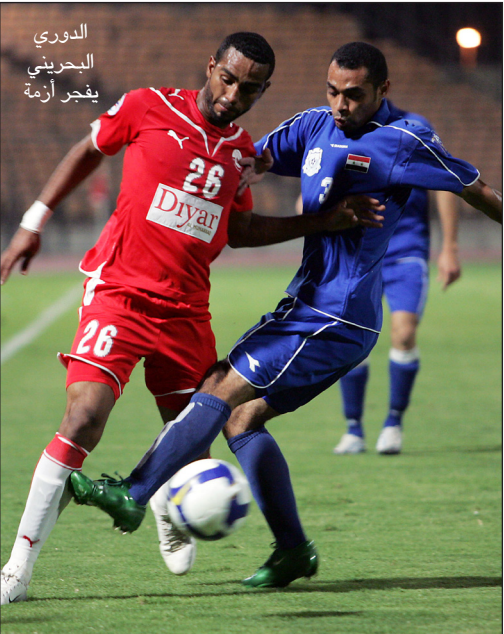
الدوري البحريني يفجر أزمة