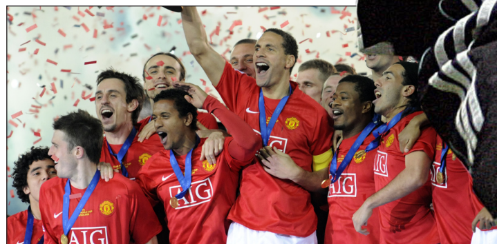
أوين يركز جهوده مع مانشستر يونايتد

أعلنت الإمارات العربية المتحدة بدء العد التنازلي لانطلاق بطولة كأس العالم للأندية التي تضيفها العاصمة أبوظبي في الفترة من ٩ إلى ١٩ كانون الأول المقبل، وتجري حالياً التجهيزات على قدم وساق لاستقبال الحدث العالمي الكبير، على ملعب مدينة زايد الرياضية و محمد بن زايد في نادي الجزيرة، فضلاً عن قرب الانتهاء من إقامة عدد من ملاعب التدريب الجديدة، أهمها ذلك الذي سيتواجد في فندق قصر الإمارات، مقر إقامة وفود الأندية المشاركة في البطولة. وسيتم سحب قرعة كأس العالم للأندية يوم غد الخميس، في فندق قصر الإمارات، وهو يوم إقامة مباراة المنتخب الإماراتي أمام فريق مانشستر سيتي الإنكليزي، ويتزامن يوم سحب القرعة مع ورشة العمل المشتركة بين الإعلام الرياضي الإماراتي، ونظيره العالمي وممثلي اللجنتين المنظمين. وستناقش الورشة التي ستستمر ساعة كاملة في إحدى قاعات قصر الإمارات عددا من الأمور المهمة الأخرى والعلاقة بين الإعلام والرياضة والارتباط الوثيق بينهما وسبل تطوير طرق التغطية الإعلامية للبطولات التابعة للاتحاد الدولي لكرة القدم وتحديدا بطولة كأس العالم للأندية. وعقب الورشة تبدأ مراسم القرعة التي ستكون بحضور مسؤول رسمي، إضافة إلى عدد من الشخصيات الرياضية الكبرى على المستوى العالمي.