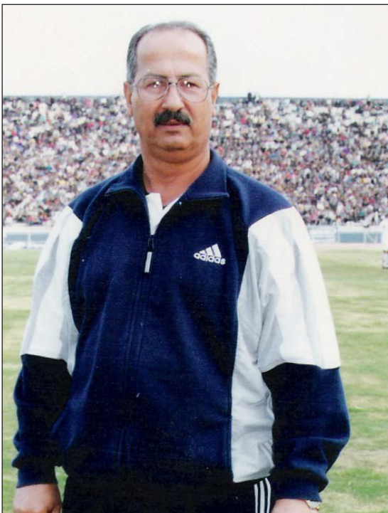
أفضل مدرب عراقي برصيد الإنجاز

ببطولة كأس. وفي عام ١٩٩٣ نجح في جلب نخبة ممتازة من اللاعبين الذين أحرزوا فيما بعد عدة بطولات محلية مع مدربين آخرين. حيث ابتعد عن الزوراء بسبب تداعيات الخسارة الكبيرة مع فريق ايبست بنغال (٢). في بطولة كأس الاتحاد الآسيوي. حيث قرر خوض تجربة الاحتراف مع نادي الهلال السوداني وقاده للفوز بالدوري والكأس ثم كانت له رحلة مميزة مع نادي الوحدات الأردني توج خلالها بلقبه الدوري والكأس ومن ثم تعاقد مع نادي الاتحاد القطري "الغرافة حالياً" وحقق معه نتائج جيدة قبل أن يتم استدعائه لتدريب المنتخب الأولمبي عام ١٩٩٥ وفي عام ٩٨.٩٧ عين مدرباً للزوراء وبعد ذلك عاد إلى السودان مع فريق الهلال أيضاً ثم