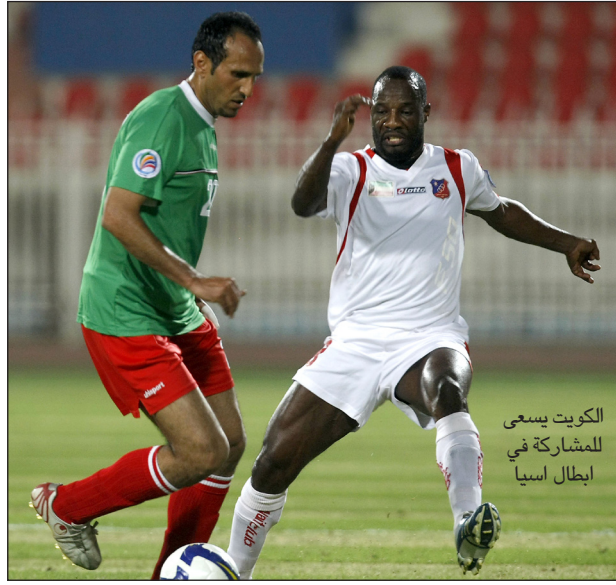
الكويت يسعى للمشاركة في أبطال آسيا

فرصة الترشح للمشاركة في تصفيات دوري أبطال آسيا للعام المقبل. وستنافس ثمانية أندية موزعة على منطقتي شرق وغرب آسيا من أجل الفوز ببطاقتين للمشاركة في البطولة الأولى على مستوى الأندية في القارة الآسيوية. وذكر الاتحاد الآسيوي سيتنافس الكويت بطل كأس الاتحاد الآسيوي هذا العام والكرامة مع فريق الوحدة الإماراتي وبرونز تشيرشل الهندي من أجل الفوز ببطاقة التأهل عن منطقة غرب آسيا إلى دوري أبطال آسيا 2010. وفي المقابل تتنافس أندية سريويجايا الإندونيسية والجيش السنغافوري وموانغ ثونغ يونائيتد التايلاندي ودا نانغ الفيتنامي من أجل الحصول على بطاقة منطقة شرق آسيا.