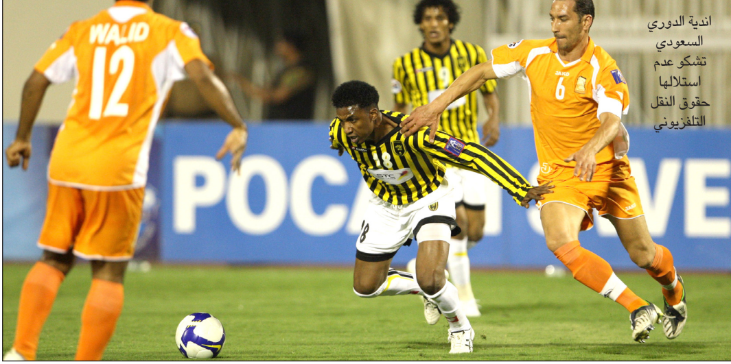
اندية الدوري السعودي تشكو عدم استغلالها حقوق النقل التلفزيوني

في ما يتعلق بالصفقة بين الشبكتين. من جهة أخرى يرجح ان يجتمع مسؤولو عدد من القنوات الفضائية الخاصة بالاندية والتي تحتضنها الشبكة المحنكرة حاليا مع ادارة (art) للبحث بخصوص مستقبل قنواتهم في حال تمت الصفقة. وترجح المصادر نفسها تلقي ادارات هذه القنوات تطمينات بأن قنواتها لن تمس بأي شكل من الاشكال في حال تمت الصفقة المرتقبة التي باتت حديث الوسط الإعلامي الخليجي والعربي بشكل عام. يذكر ان الكثير من ادارات الاندية في مختلف الدرجات الممتازة والاولى والثانية ابدت استياءها من عدم استغلالها حقوق النقل التلفزيوني لمباريات فرقها ولم يخف بعضهم قلقه من ان تضيق حقوق ناديبهم جراء الصفقة في حال اتمامها رسميا.