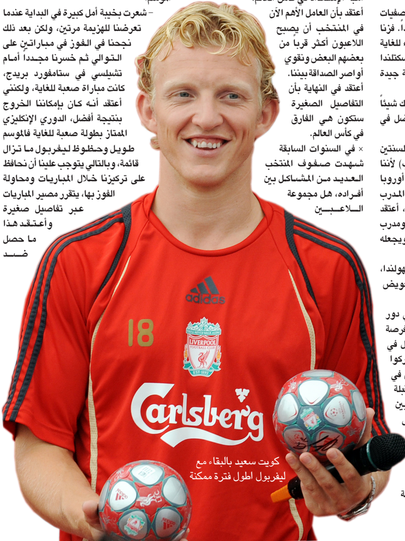
كويت سعيد بالبقاء مع ليفربول أطول فترة ممكنة

ومنذ أن خاض أول مباراة دولية بإشراف المدرب ماركو فان باستن عام 2004، لم يغب كويت عن صفوف منتخب بلاده فشارك معه في كأس العالم ألمانيا 2006، وفي كأس الأمم الأوروبية 2008. ويأمل كويت الذي خاض حتى الآن 10 مباراة دولية أن يقود منتخب بلاده لتقديم عروض رائعة في جنوب إفريقيا 2010 بعد الخروج المخيب من النسخة الأخيرة في ألمانيا 2006.