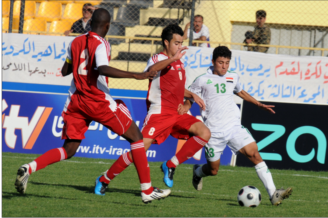
بوابة عمان فتحت الامل لشبابنا بالتأهل الى نهائيات البطولة