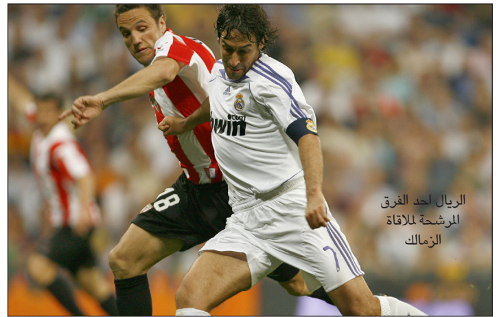
الريال احد الفرق المرشحة للقاء الزمالك