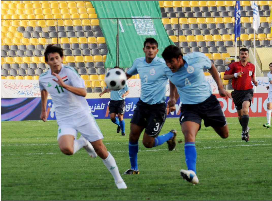
جانب من لقاء العراق والهند الذي انتهى بخمسة نظيفة للشبابنا

ضيافة العراق لتصفيات المجموعة الثالثة المؤهلة لنهائيات كأس آسيا للشباب كانت خطوة كبيرة باتجاه إعادة الثقة لمنتخبات الدول الآسيوية والعالمية بحقيقة ان العراق اصبح آمناً ولديه الامكانية في احتضان البطولات المختلفة بشعار الضيافة والكرم الذي كان وما زال هو السمة البارزة لشعبه الودود المحب لكل زائر بعيداً عن حسابات المنافسة وما تسفر عنه النتائج .