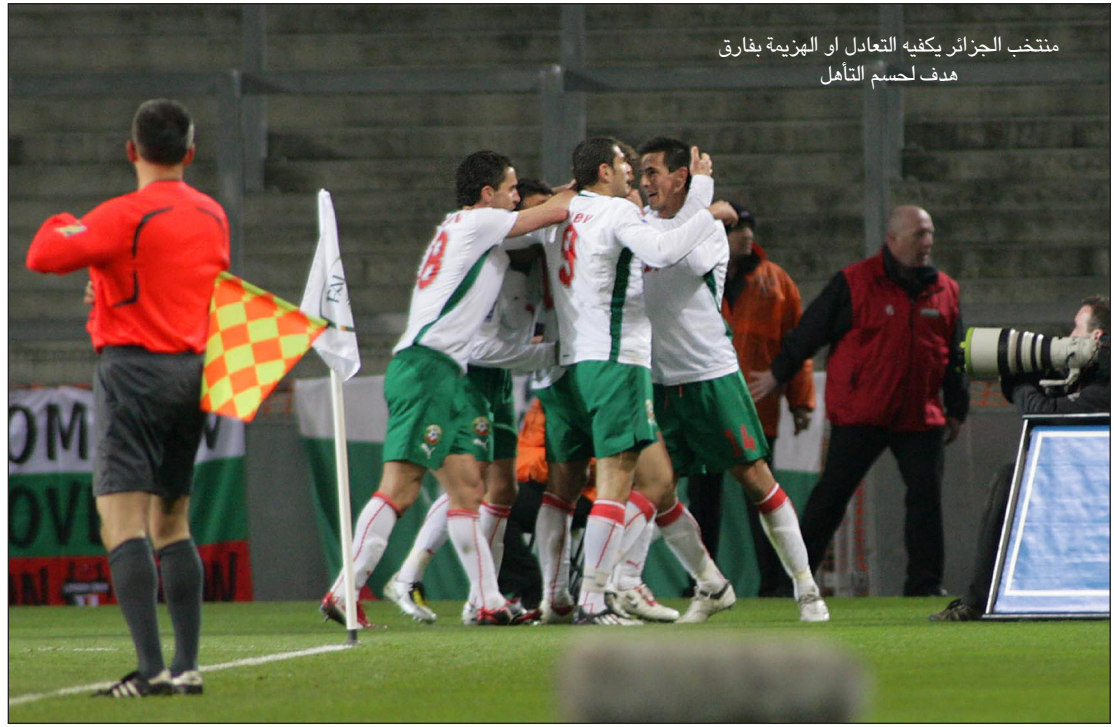
منتخب الجزائر يكفيه التعادل أو الهزيمة بفارق هدف لحسم التأهل