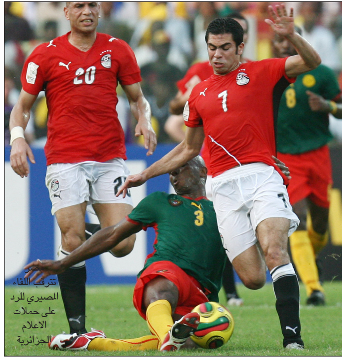
تترقب اللقاء المصري للرد على حملات الاعلام الجزائرية