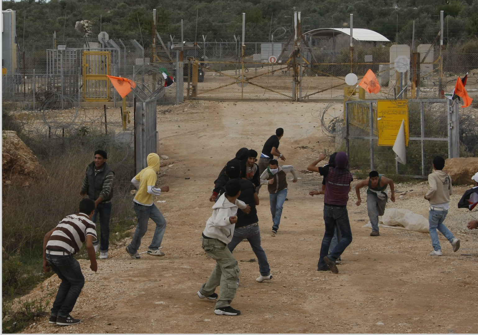
شبان فلسطينيون يرمون الحجارة

وخلال زيارته سيوقع كوشنير معاهدة في هذا الخصوص مع الهلال الاحمر الفلسطيني. وسيوافق على وثيقة اطار لشراكة على ثلاث سنوات حول التعاون مع الاراضي الفلسطينية. لكن بحسب الصحف الاسرائيلية قد تكون اسرائيل رفضت السماح بزيارة الوزير الفرنسي لمستشفى غزة وقد تكون مسؤولة عن تأجيل زيارته التي كانت مقررة اصلا في نهاية الشهر الماضي بسبب رسالة فرنسية-بريطانية طالبت بتحقيق مستقل حول الحرب على غزة لم ترق لتناجهاو.