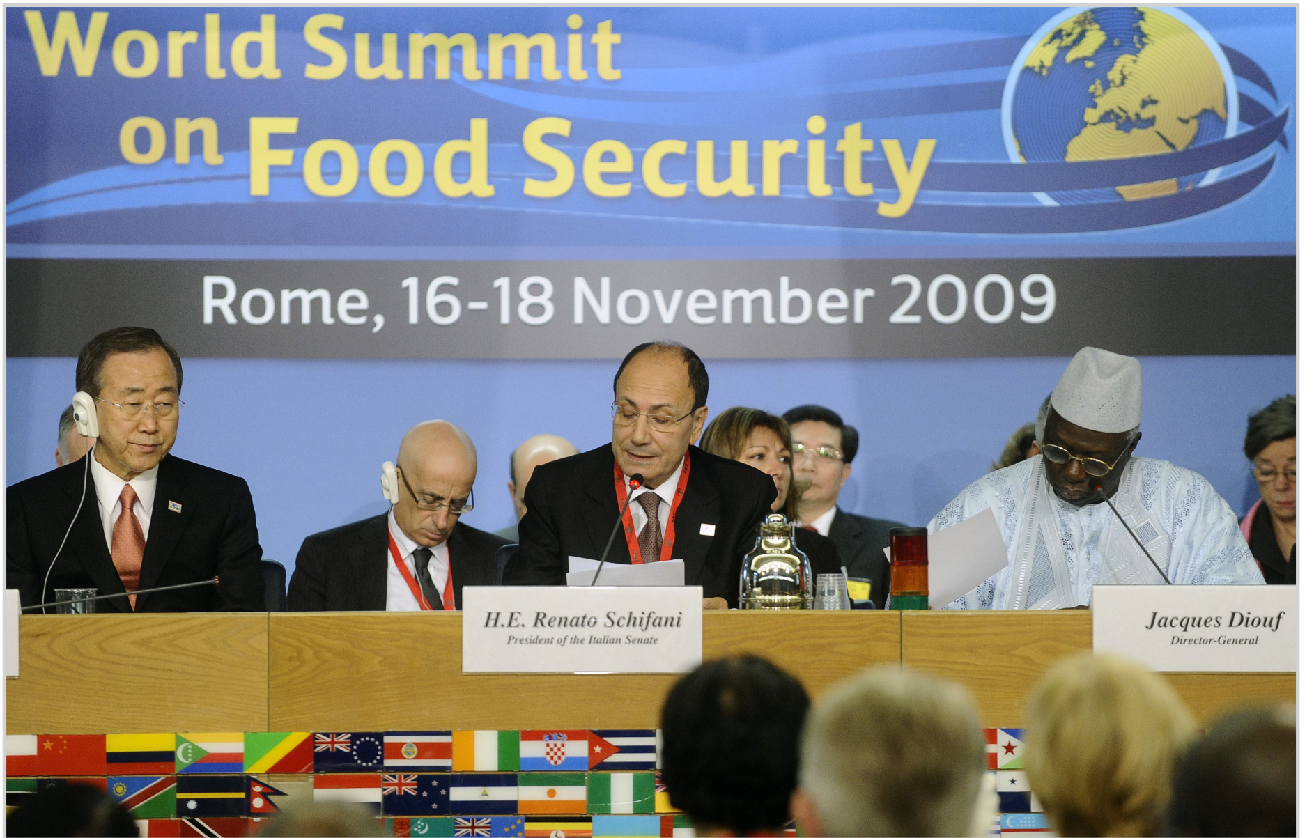
قمة روما للغذاء العالمي..

نعتقد أن القضاء العادل يؤكد أهمية العدل في دستور ذلك البلد وبالتالي فإن الناس ليس أممها غير احترام بلدانها والدفاع عنها ما دام دستورها يكفل الإقرار بالعدل بالشكل الذي نراه في أمريكا. وماذا نتحدث عن القضاء فلان إن تأتي إلى القضاء العراقي كيف يتولى بصبر ومهنية عالية مجرمي النظام السابق، وكيف يتعامل مع جرائمهم بشكل فري بعيداً عن السياسة وتأثير الجهات الحزبية والحكومية، ولذلك فقد أثبتت الأيام مصداقية الجهاز القضائي في بلدنا وهو يحاكم اعنى المجرمين الذين امعوا في خراب بلد ٣٥ عاماً وابتداءات أشنع من اعتداء خالد شيخ محمد في ١١/٩ سبتمبر.