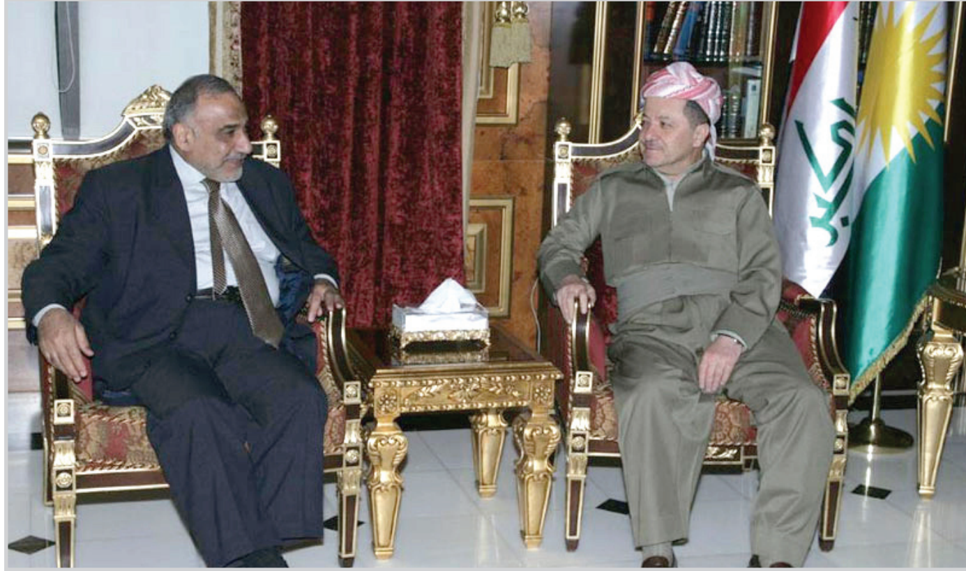
رئيس إقليم كردستان مع د. عادل عبد المهدي

وخلال اجتماع بين الجانبين، تم التطرق الى الأوضاع الراهنة على الساحة العراقية، حيث قدم نائب رئيس الجمهورية تهنائه بمناسبة تسلم الدكتور برهم صالح مهام منصبه الجديد، متمنياً أن يعمل الجميع في بغداد وأربيل على حل المشاكل العالقة عن طريق الحوار بين الجانبين. وأكد الجانبان خلال اللقاء على ضرورة إجراء الانتخابات التبادلية في موعدها المقرر وفقاً للدستور العراقي، وببذ الصدد أشار رئيس حكومة إقليم كردستان الى ضرورة مراعاة حقوق جميع المكونات العراقية، لافتاً الى ان إجراء انتخابات حرة ونزيهة سيؤدي الى تعميق الديمقراطية وتطوير روح المسؤولية المشتركة التي يظل العراق بأمس الحاجة اليها.