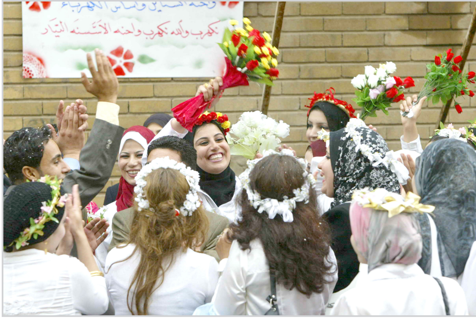
من احتفالات تخرج الطلبة

المتقدم من ٣٥ سنة وأن يقدم ما يؤيد اجتيازه امتحان الكفاءة وستكون الدراسة باللغة الانكليزية وتبدأ في ٢٠١٠/١٠/١٠. ويمنح المرشح المقبول مخصصات شهرية قدرها