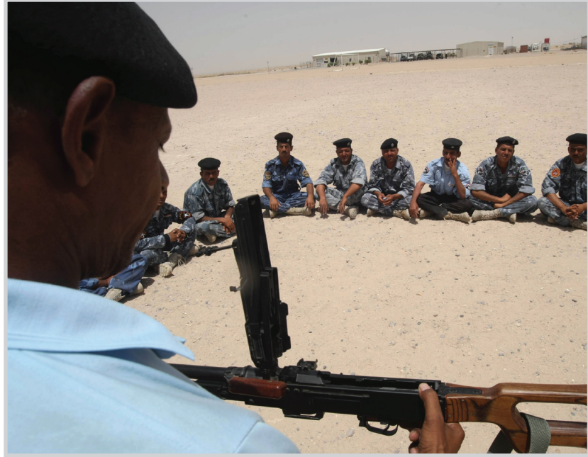
تدريب حرس سجن الاصلاح

الآخرين بطريقة سليمة. "ان التدريبات التي يتلقاها حرس الاصلاح سواء في الرماية أو العمل الوظيفي يعمل على تقريب خطوات معسكر كروبر لتسليمه في نهاية المطاف إلى حكومة العراق.