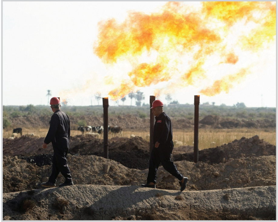
استمرار حرق النفط

تظاهر ذوو الشهداء والسجناء السياسيين في ساحة الفريوس ببغداد مطالبين بتنفيذ القوانين المتضمنة لحقوقهم. ودعا المظاہرون الجهات المسؤولة التي تشكل لجنة من مجلس الوزراء والوزارات المعنية بحقوق الشهداء لتلبية الاستحقاقات التي تتضمنها قوانين مؤسسة الشهداء التحديد الاول للمؤسسة وقانون تعديل الاول للخدمة المدنية الخاص بتعديل القوانين المتعلقة بحقوق ذوي الشهداء.