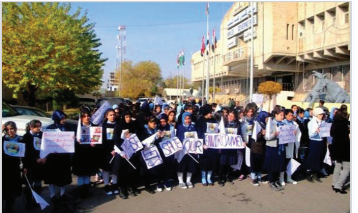
طلاب يطالبون بحماية البيئة