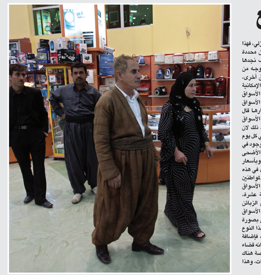
متسوقون في احد الاسواق

تسوق ربة البيت من الأسواق التي قد تكون بعيدة وتحتاج لوسائل نقل لوصولها فإنها موجودة في نفس منطقة سكنها، هذا النوع من الأسواق يعد الحل البديل للاستغناء عن استخدام وسائل النقل، وعلى العكس، فالتنوع ينفع للشراء ويجمع العديد من المواد دون ان يتركها مستجم مبلغاً لم يكن يتصوره السوبرماركت، ان انخفاض الأسعار يشمل قسماً من المواد بينما الأخرى مرتفعة بمعنى ما يخفف من سعرها يضاف فرقه على سعر المادة الأخرى، لكن الأغلبية قد لا تترك ذلك، فأصبح الإقبال على هذه الأسواق (مودة).