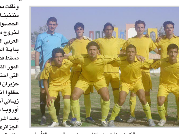
الكرك وزاخو في لقاء مهم ضمن الدوري التأهيلي

وزيادة على ذلك، فإن زباني يتحل في هذا الاستفتاء، الجزائر، التي تعد البلد العربي الوحيد المخاض الى كأس العالم والمصري محمد أبو تريكة، الذي يعد منافسا قويا لزباني للتتويج بلقب اللاعب الأكثر شعبية في البلدان العربية، رغم أن منتخب "الفراعة" أخفق في اقتطاع تأشيرة المرور الى كأس العالم، والتونسي أمين الشرميطي والمصري هشام بوشروان واليبي طارق النابيد والسوداني هيثم مصطفى والفلسطيني فهد عتال والسعودي محمد نور والسوري فراس الخطيب والعماني علي الحبسي واللبناني محمد غدار والاردني عبد الله ذيب والاماراتي إسماعيل مطر والبحريني محمود عبد الرحمن رينجو والكويتي بدر المطوع واليمني علي النونو والقطري سياستيان سوريا.