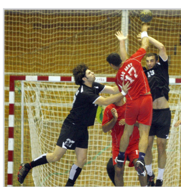
منتخبنا بكرة اليد يسكر في رومانيا استعداد لآسيا

واضاف جلوب: ان المنتخب الوطني من المؤمل ان يخوض عشر مباريات هناك مع اندية رومانية وتحضيرا للبطولات والمشاركات المقبلة. وفي الشأن ذاته اوقعت قرعة البطولة الآسيوية الرابعة عشرة لكرة اليد والتي ستقام في العاصمة اللبنانية بيروت للفترة من السادس من شهر شباط المقبل بينما تستمر منافسات البطولة لغاية الثامن عشر من نفس الشهر والتي سحيت في مقر الاتحاد الآسيوي في العاصمة الكويتية منتخبنا الوطني في المجموعة الاولى (الصعبة) والتي ضمت الى جانبه منتخبات السعودية والصين وسوريا، فيما ضمت المجموعة الثانية منتخبات الكويت واليابان والبحرين، فيما ضمت المجموعة الثالثة منتخبات كوريا الجنوبية وقطر والامارات والاردن ويران ولبنان. وكان الاتحاد الآسيوي خلال سحب القرعة قد قسم المنتخبات المشاركة الى اربعة مستويات، حيث ضم