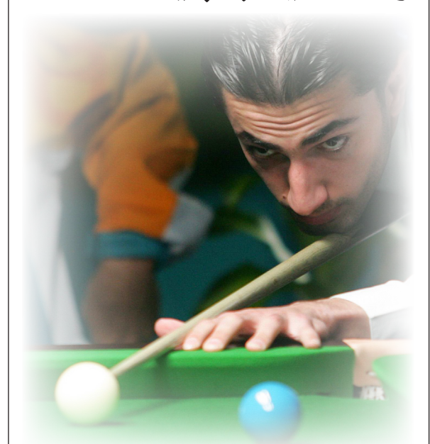
جانب من منافسات بطولة العرب للبيارد