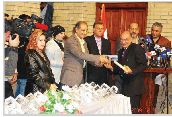
الفنان البصري يوزع الجوائز