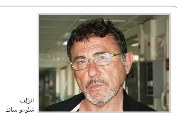
المؤلف شلومو ساند

ولكنها لم تطرد ابداً جميع السكان، فهي على الأقل كانت بحاجة الى خدمتهم. ان الدليل التاريخي، كما يقول المؤلف يظهر ان مجموعات يهودية كانت تعيش عند البحر الابيض المتوسط ومنهم ربما قبل ٧٠٠ بعد الميلاد. وقد قال شيترون متفهماً في ٥٩ قبل الميلاد: "انتم تعرفون كم هي متعددة الجماهير، وكم هي كبيرة".