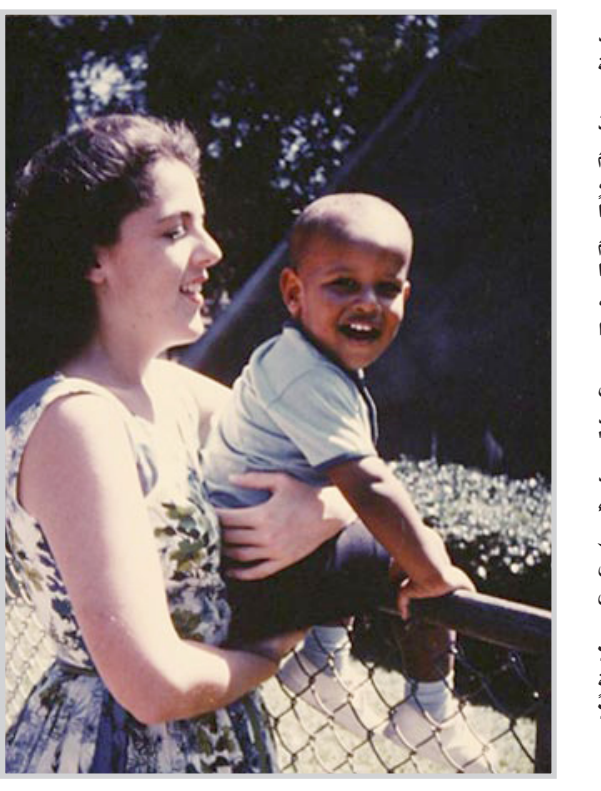
أوباما مع والدته

نحس تصوير فلأحي أندونيسيا يكونهم مرتبطين بالتقليد وغير عقلانيين، و ميالين إلى وضع الحاجات الاجتماعية المطنبة فوق الحسابات الاقتصادية الحقيقية". و تعتبر الأنسة سويتورو أمها راذة في مجالها أيضاً، إذ " أن عملها في التمويل المصرف كان ريادياً، و لو أنني لم أدرك ذلك في حينه، و الآن حظي هذا العمل بتسعيبة كبيرة، وهناك عدد من الناس الذين يرون التمويل المصرف وجهاً مهماً للتنمية القابلة لل دعم و الاستثمار " و كانت دنهام تريد أن ترى تلك الطريقة تستخدم بشكل واسع، لكنها توفيت قبل أن تحظى بفرصة للمحاولة. " ذلك كان هدفها، أن تصل إلى كل ركن من أندونيسيا، بل و إلى أبعد من هذا " تقول ابنتها. إن من الممكن أن يجد الكتاب جمهوراً وسط الأثري و بولوجيين وربما في مجتمع التمويل المصرف. و يستذكر السيد ويسوكري أنه في لقاء أثري و بولوجيا العام الماضي كانت ننتاب الجميع الاثارة لكوننا سيرا أسوأ رئيس جديد كانت أمه متخصصة الأثري و بولوجيا، و كانوا سعداء لأن ينسبوا بعض آرائه الأكثر اتساعاً و بقة عن العالم و الثقافات الأخرى إلى تأثيرها الطيب عليه. " و هو ما توافق عليه الأنسة سويتورو.نغ. فذلك الإحترام الطبيعي الذي كان لديها تجاه الناس جميعاً شيء تعلمته منها " كما قالت. فهل أقر الرئيس كتاب أمه؟ تقول الأنسة سويتورو.نغ " لا أري " مضيفة أن دنهام قد شاطرت السيد أوباما الأطروحة حينما كانت تكنتها، " و هو لديه نسخة، لكنه كان مشغولاً جداً "