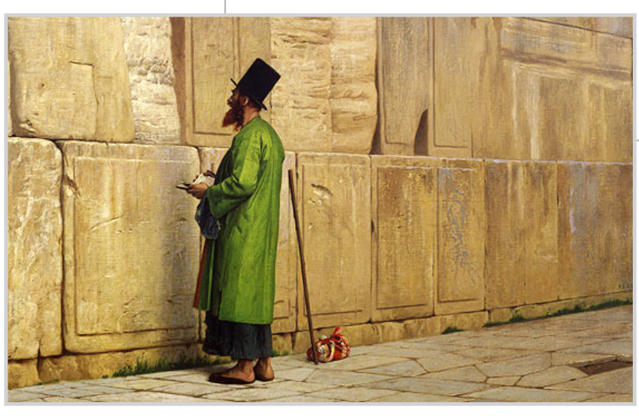
يهودهم فيها بعد ذلك. ان بعض الفلسطينيين اليوم ربما انحدروا من اسرئيليين في الحاضر هاجروا من روسيا.

ويقرّح المؤلف ان هجرة اقتصادية كانت متواصلة من فلسطين بعد سقوط المعبد ولكن غالبية اليهود بقيت في اماكنها، تحولوا الى الاسلام بعد سيطرة المسلمي في القرن السابع على القدس وتواصل