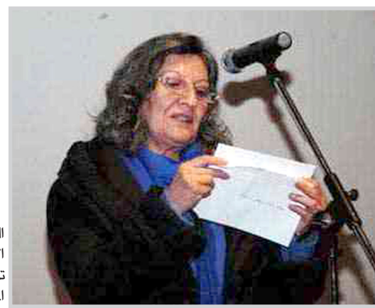
السيدة الاولى ترعى المهرجان