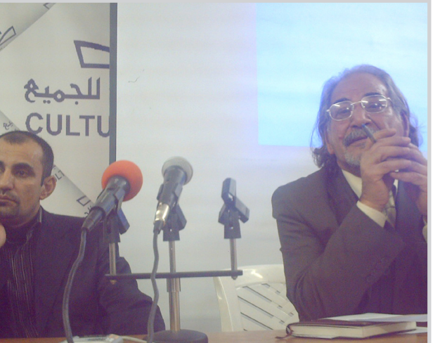
احتفت جمعية الثقافة للجميع يوم الخميس بالفنان المبدع بشير الماجد ضمن نشاطاتها في الاحداف بالإبداع العراقي، وقد أقيمت الجلسة الفنان

وقامت استطاعت ان تحرك رغم الظروف الصعبة واستطاعت ان تحضر اسمها في سجل السينما العراقية وفي المشهد السينمائي، يلتقي بشير الماجد ممثل ومخرج سينمائي بكمبيوتر فنون سينمائية من اكااديمية الفنون الجميلة عام ٢٠٠٧ قام بدور البطولة للفيلم الروائي - احلام - للمخرج محمد الراجي عام ٢٠٠٥ وحصل على جائزة افضل ممثل في مهرجان -بروكلين- في نيويورك عام ٢٠٠٦ وحصل على جائزة افضل ممثل في مهرجان قرطاج عام ٢٠٠٦ وذلك عن دوره في فيلم -احلام- قام بتأليف وإخراج فيلمه الشخصي -تقويم شخصي- عام ٢٠٠٨ حصل عليه من الجوائز لهذا الفيلم. وتحدث الفنان بشير الماجد فقال: إن السينما العراقية انتجت ٩٩ فيلماً منذ الاربينيات حتى عام ٢٠٠٠ وهذه النسبة تعتبر ضئيلة جدا نسبة للعلم الهائل للاتنتاج السينمائي العالمي، واليهدم معظم انتاجها السينمائي في كل ثلاث ساعات تنتج فيلماً، ومثلما تعرفون ان السينما العراقية تألجت بحزام يمينها في الفترة السابقة وكانت تحاكي اوضاع السلطة المستبدية واتجهت اتجاهات غير ما منحصر لهذا الفن، بعد ٢٠٠٢ شرع المخرج عدي رشيد