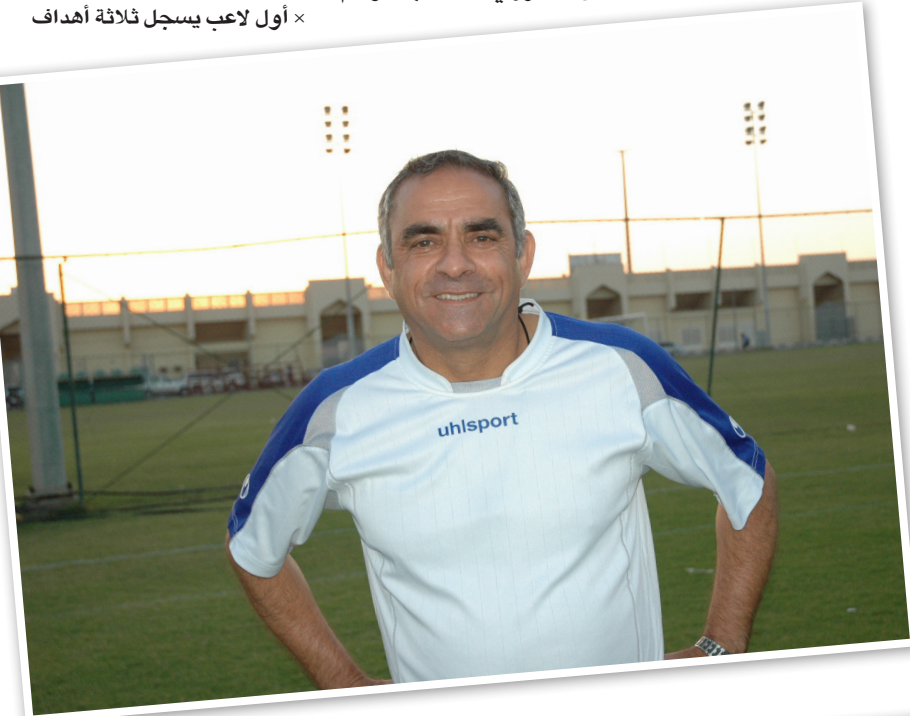
جمال علي عميد جيل الانيق الذهبي

أول هداف في الدوري العراقي سجله اللاعب كاظم وعمل من نادي المواصلات في مرمى نادي الشرطة ( الرمزي ) في الدقيقة ٢٢ من مباراة الفريقين في الدور الأول لموسم ٧٤-١٩٧٥ والتي جرت على ملعب الميناء يوم الجمعة ٤ تشرين الأول ١٩٧٤ وانتهت لصالح المواصلات ٣-٠ صفر وأخر هداف سجله لاعب دهوك خالد مشير في مرمى نادي الأمانة في الدقيقة ٤٧ من مباراة تحديد المركزين