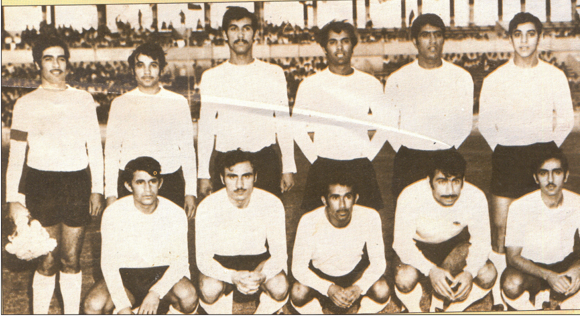
الاول جلوساً من جهة اليسار مع المنتخب الوطني عام ١٩٧٣ في كأس فلسطين