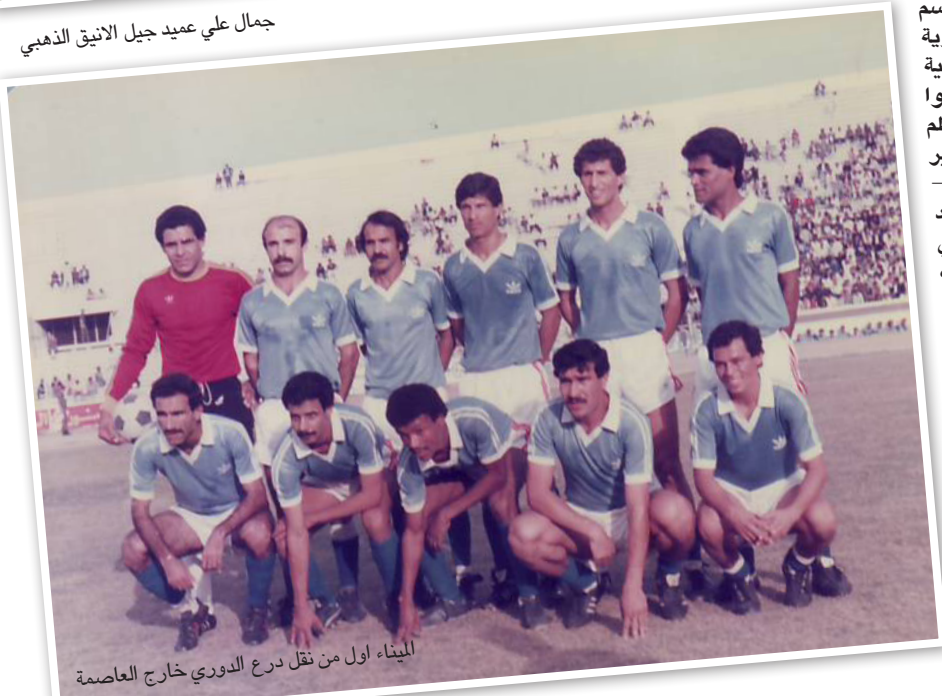
الميناء أول من نقل درع الدوري خارج العاصمة