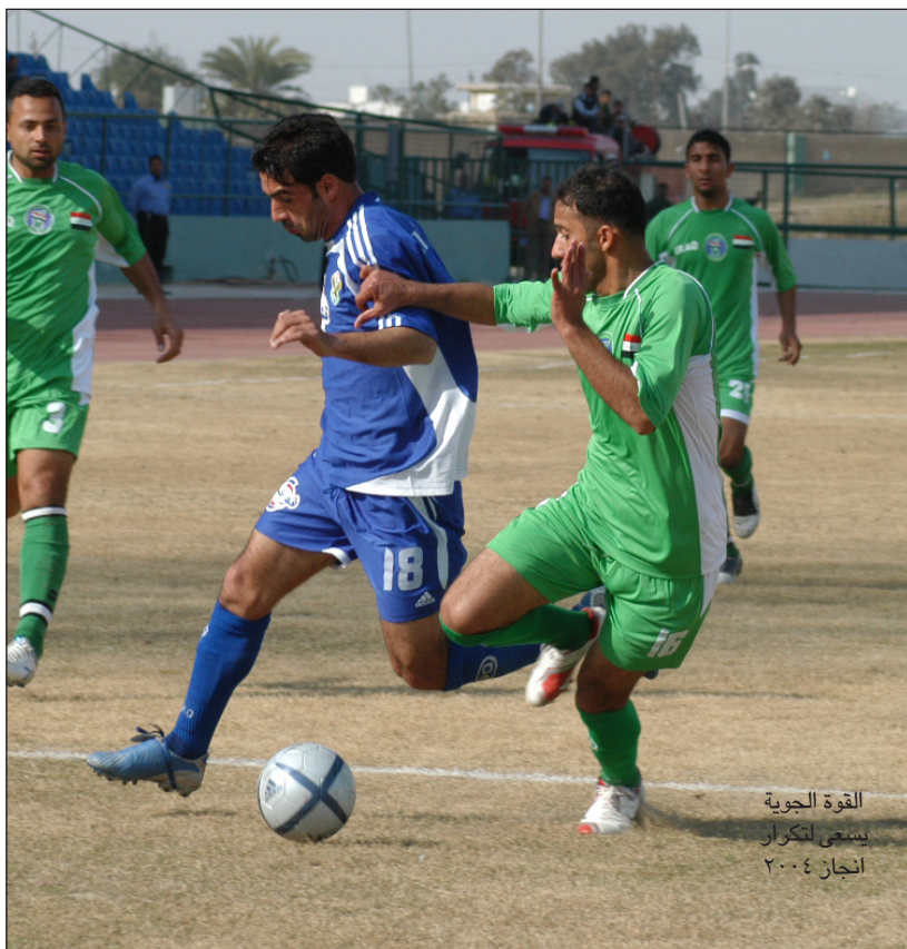
القوة الجوية يسعى لتكرار انجاز ٢٠٠٤