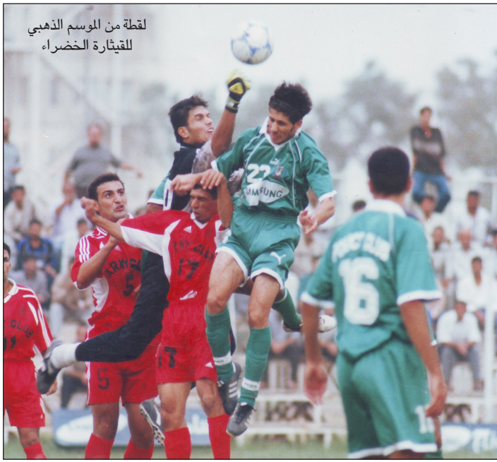
لقطة من الموسم الذهبي للقيتارة الخضراء

مباراة يلعبها الفريق في المرحلة الثانية انطلاقا من مباراتنا مع الصناعة وحتى المباراة الأخيرة يأتي بديك ويصر على نذحه لحظة نزول اللاعبين إلى أرض الملعب وبالفعل كنا نحقق الفوز في كل مباراة نحرر الدماء فيها، وكى لا أنسى أن فريقي حقق ١٢ فوزا متتاليا وهي حالة نادرة في الدوري العراقي لكنها مرت بهدوء دون هالة إعلامية.