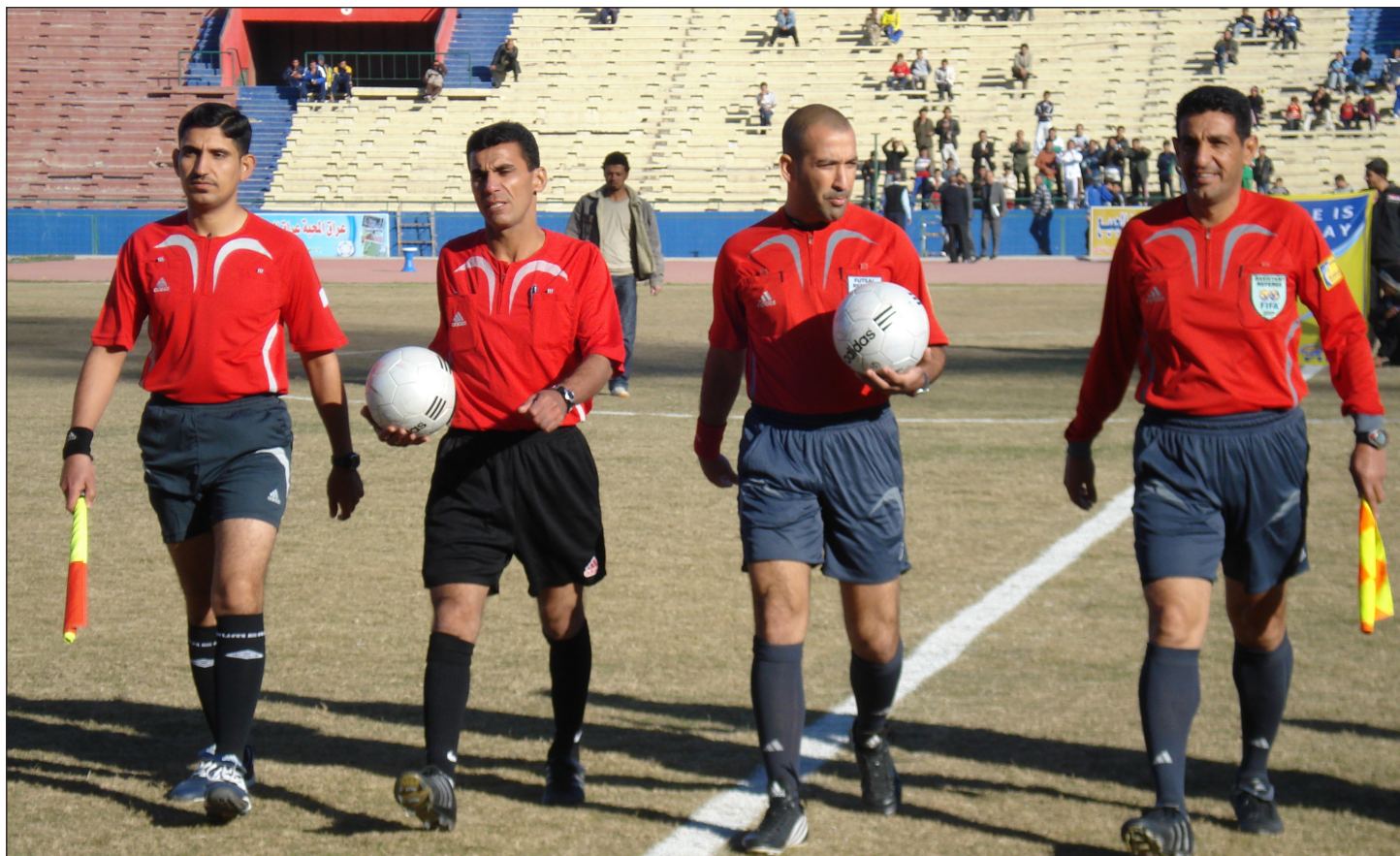
الحكام الشباب امام اختبار صعب في الدوري