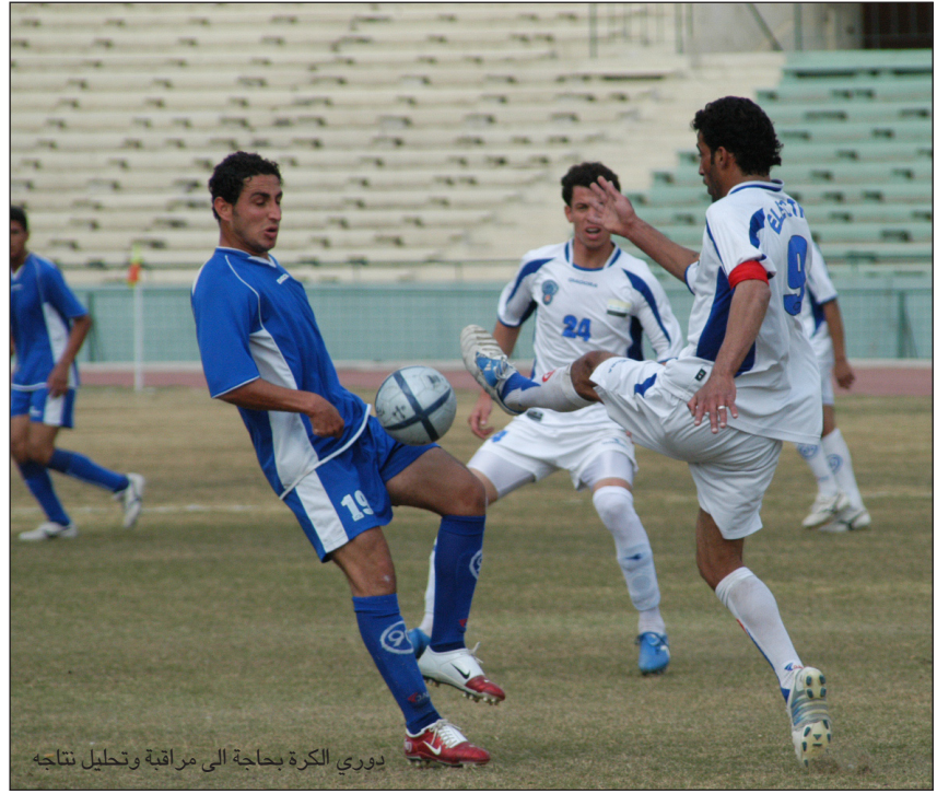
دوري الكرة بحاجة الى مراقبة وتحليل نتاجه

واشار السلطان الى ان التغطية الاعلامية للموسم الكروي الجديد ستكون متميزة خاصة بعد ان شهد الدوري الجديد ولادة قصيرة بفضل التاجيات الثلاثة التي شهدتها بسبب ازمة الاتحاد العراقي لكرة القدم ، ما يعني ان التغطية الاعلامية ستكون فوق العادة ولن تشمل التغطية المحلية بل انها تتعدى الى التغطية العربية والعالمية ، ونتمنى ان تكون التغطية حيادية وموضوعية خاصة ان زملائنا نجحوا في المواسم السابقة في اعطاء صورة ايجابية عن الكرة العراقية.