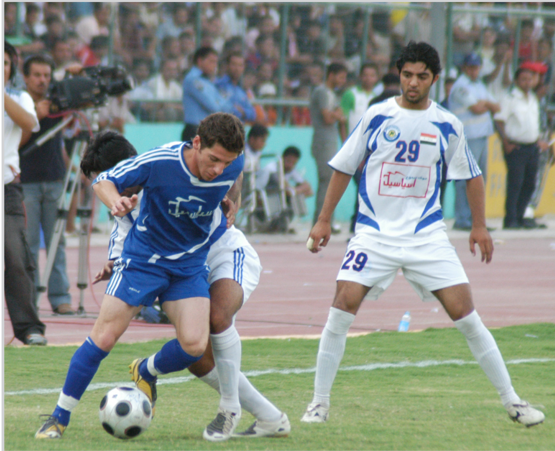
الدوري الممتاز يواصل مباريات الدور الأول بواجهات مثيرة

وتتمنى ان لا يلقى فشل الحوار بين الطرفين بظلاله على مسابقة الدوري الممتاز بكرة القدم التي انطلقت امس بمشاركة ٢٦ ناديا خاصة أن نادبي السلمانية وسيروان اعلا انسحابهما من الدوري الممتاز في المجموعة الشمالية قبل يوم واحد من انطلاق الدوري لاسباب مادية ، ونخشى ان تلحق بهما اندية أخرى لسبب أو لآخر طالما ان الصورة مازالت قائمة وغير معروفة العالم بظل وجود بعض الاراديين الذين فشلوا في ادارة انديتهم واليوم يخططون لإدارة الاتحاد العراقي بشكل مؤقت ولفترة غير محددة.