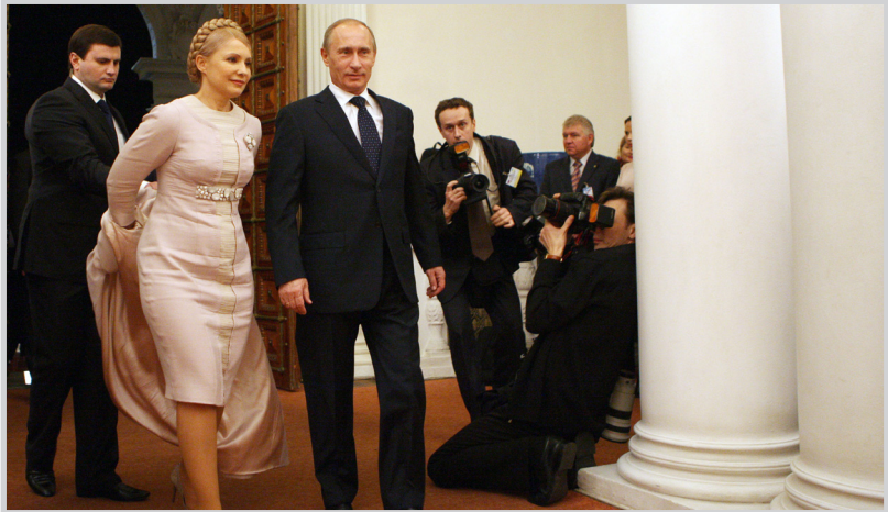
بوتين مع رئيسة وزراء أوكرانيا

أثناء عن سقوط عدد من رجال الأمن في هجومي انتحاريين في العاصمة الشيشانية غروزني. ٩/١٢ الاندبندنت: جورجيا تنصاع أمام قوة روسيا الحرب المشتعلة بين روسيا وجورجيا ما زالت تهتمين على الصحافة البريطانية، التي أظهرت الانذار العسكري لجورجيا أمام القوة العسكرية الروسية. ٨/١١ مع تولي مديفيد مقالبيد الرئاسة الروسية، تدخل روسيا مرحلة جديدة تمتاز بثباتية القيادة: مديفيد-بوتين بعد ان ظل الأخير مهيمنا على الساحة السياسية خلال السنوات الماضية. ٥/٧ وسط تعتميم إعلامي، عقدت اللجنة الرباعية الدولية المتصلة بعملية السلام الشرق أوسطية (من بينها روسيا) اجتماعاً مغلقاً في عمان على مستوى الوفود، حسباً رشح من مصادر دبلوماسية. ٤/١٧ زادت الأمل بإمكانية إنهاء اعتكاف أعضاء طائفة دينية روسية في كهف بقع في منطقة تلجية حيث يخشى على حياتهم هناك، وذلك بعد خروج سبعة من أعضاء الطائفة.