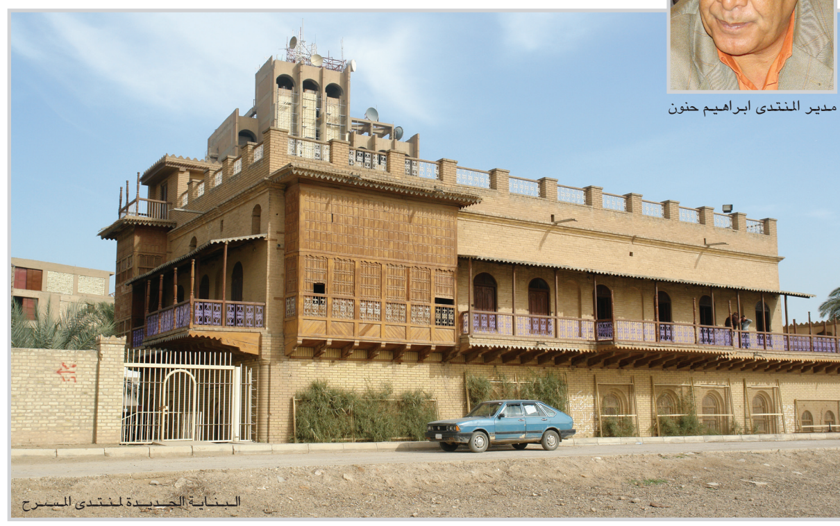
البناية الجديدة لمنتدى المسرح