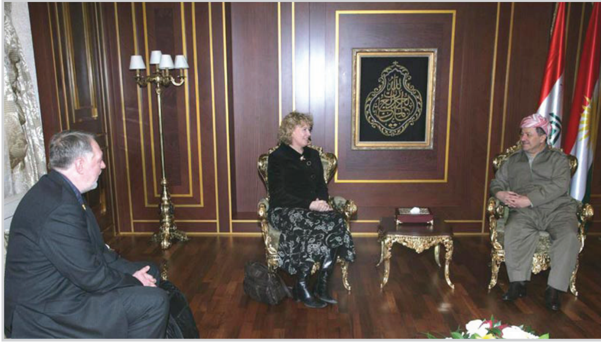
رئيس الاقليم مع الوفد البرلماني البريطاني

ختاماً أشار فلاح مصطفى إلى العلاقات التاريخية بين شعب كردستان ودولة بريطانيا مشيداً بالدور البريطاني في دعمها المستمر للعملية السياسية وإعادة بناء العراق وإقليم كردستان.