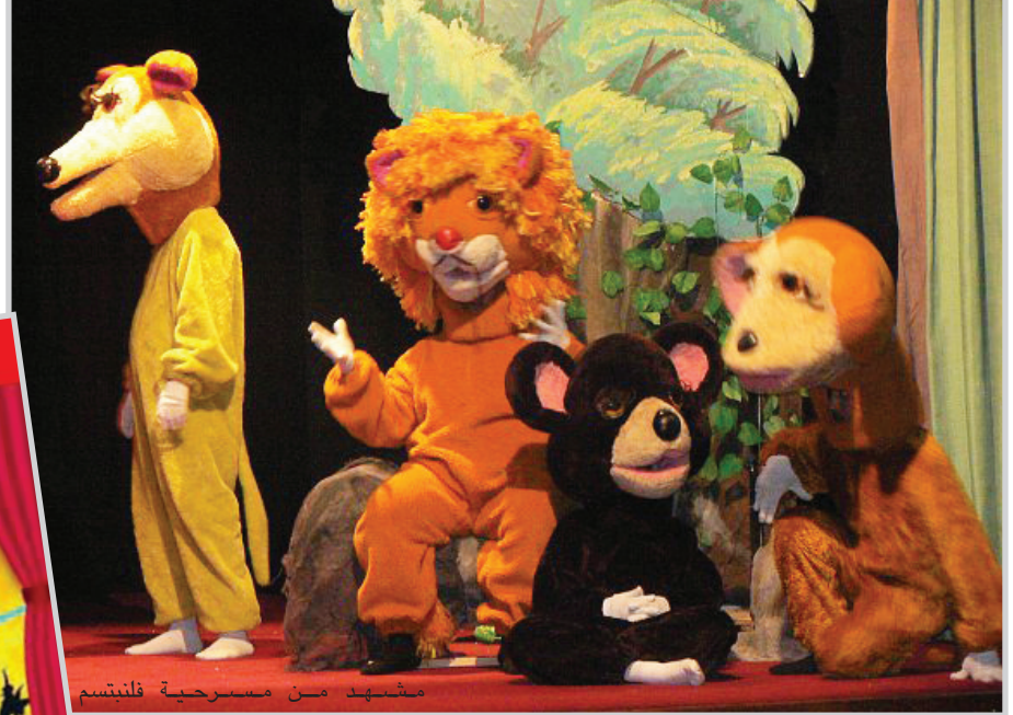
مشهد من مسرحية فلنبتسم