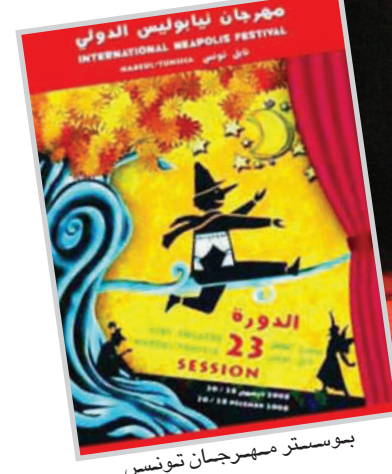
مهرجان لياوليس الدولي International Madaoulis Festival 23rd Session

زملائي حيث جمعتنا محبة مشتركة فخرجنا بنصرة النجاح، وأضاف: جسدت شخصية (ليلي) من خلال قصة ليلي والنذب وهي فتاة وديعة مدللة تحاول المساعدة والاعتراف في كل شيء ما يجعلها تقع في مشاكل وتجد لها الحل بمساعدة زملائها. أما المسرحية الثانية المحففي بها فهي مسرحية (حكاية اللؤلؤة المفقودة) التي حازت على